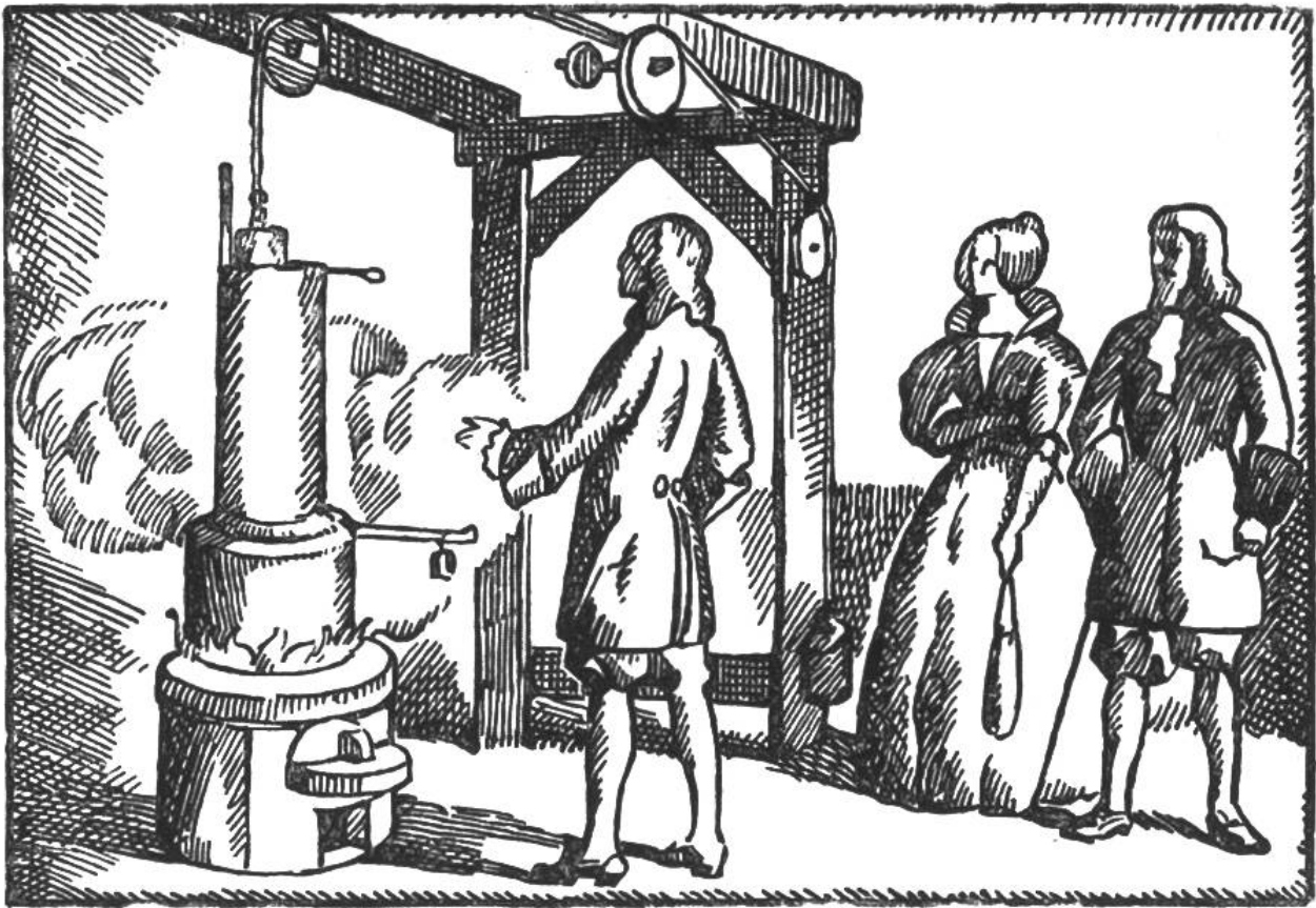
1690 Papin baut eine Dampfmaschine und verwendet das Feuer zur Krafterzeugung.

Ausgangspunkt war die Eroberung des Feuers. Das Feuer schuf uns Töpferei, Glas, Metalle, Porzellan und ermöglichte die meisten heutigen Gewerbe. Das Feuer machte den Menschen vom Klima unabhängig, setzte die Völker instand, sich über die Erde zu verbreiten und sogar den Schrecken einer Eiszeit Trotz zu bieten. Wie das Feuer als Wärmespender die menschlichen Lebensbedingungen verändert hatte, veränderte es sie von neuem durch seine direkte Verwendung bei technischen Arbeiten.