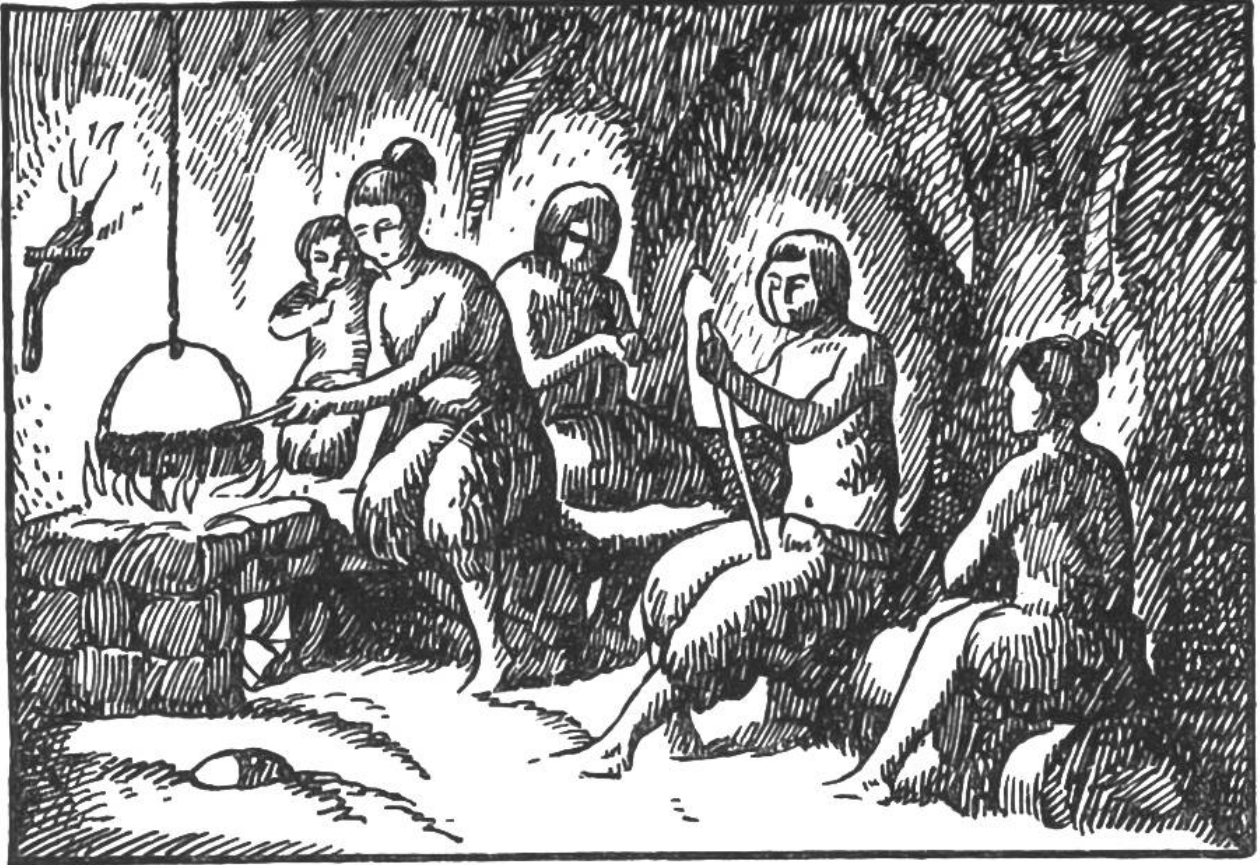
Höhlenbewohner am Herdfeuer.

Gast unbesorgt bleiben; eine eigene Höhle wurde ihm eingeräumt und die Würdigsten jedes Stammes bewachten das Feuer Tag und Nacht. Wehe dem, der die Flamme erlöschen liess! Dieses Verbrechen wurde mit dem Tode bestraft.