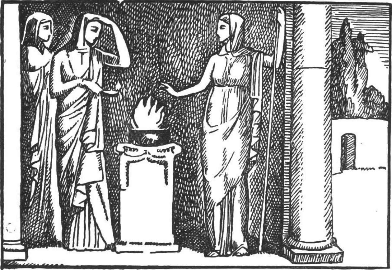
Vestalinnen bewachen das heilige Feuer.

sprühte Funken, besonders wenn es im Dunkel der Höhle mit einem eisenhaltigen Stein bearbeitet wurde. Der Mensch nannte es deshalb Feuerstein. Er lernte auch, diese Funken auffangen und beleben. Nun lag es in seiner Macht, Flammen zu entfachen, und damit begann er, Herr über das Feuer zu werden.