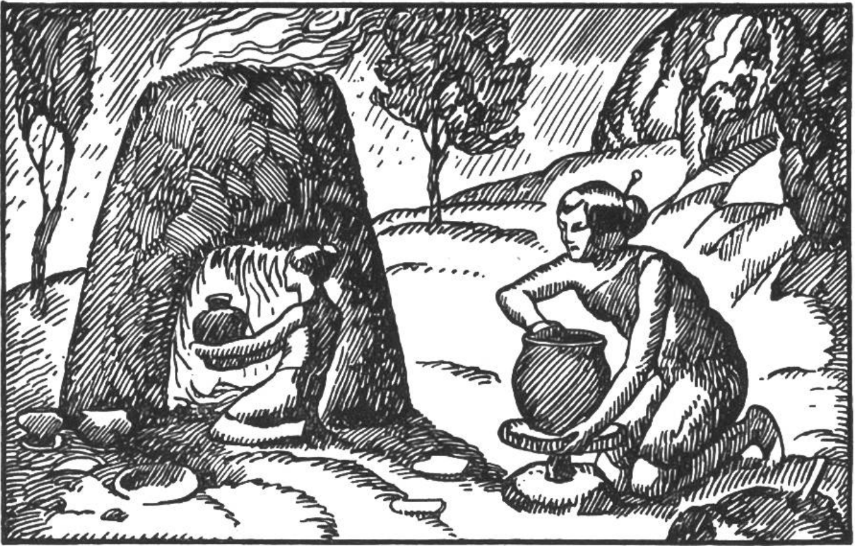
Unsere Urahnen beim Tonformen und -brennen.

Steiermark Feuerwächter ewige reine Flammen und waren dafür von allen Steuern befreit. Ihre Brandstätten dienten dazu, für Oster- und Johanniskeuer und den Herd der Neuvermählten reine Glut abzugeben. Im Frühjahr zündeten die Bauern auf den Äckern Reisighaufen mit Glut von der heiligen Flamme an. Der Rauch, der über die Felder strich, sollte die Saat vor Schaden bewahren. Der Feuerwart erhob die Hand zum Schwur, dass er das Jahr hindurch die Flamme immer getreulich gepflegt habe und dass es noch die gleiche Flamme sei, die einst im germanischen Walde « die weisse Frau » seinem Urahn geschenkt habe.