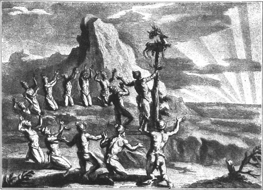
ANBETUNG DER AUFGEHENDEN SONNE DURCH UREINWOHNER VON AMERIKA. Stich aus dem Jahre 1723 nach dem Bericht eines französischen Forschungsreisenden.