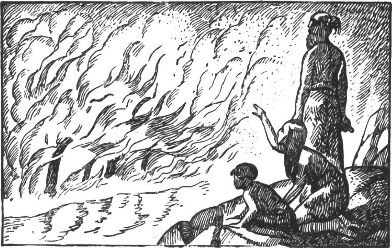
Urmenschen betrachten einen Waldbrand.