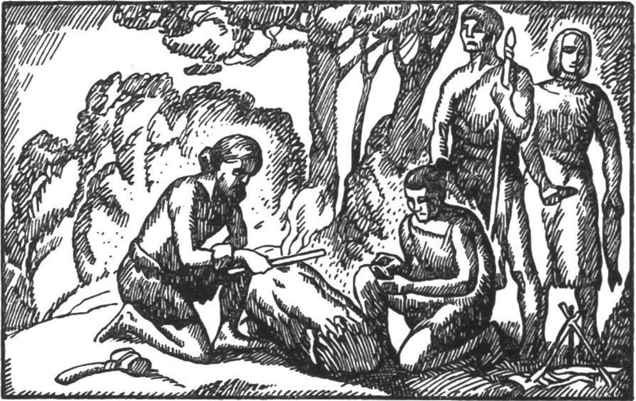
Die Menschen erlernen Feuer zu erzeugen.

Aber noch bestund die grosse Gefahr, dass das Feuer in der Regen- oder Winterszeit erlösche. Da machte ein Mensch die Entdeckung, dass sich die Flamme beliebig herbeschwören liess. Wurden zwei trockene Holzstäbe, ein harter und ein weicher, rasch und geschickt aneinander gerieben, so erschien plötzlich das himmlische Wesen; die Holzstäubchen entzündeten sich und die Funken konnten in dürrem Gras oder Laub aufgefangen und entfacht werden. Ehrerbietig wurde dem eben von Gott kommenden Boten Fett zum Empfange gereicht, damit er befriedigt und guter Laune sei, und bald loderte das Feuer helleuchtend auf. An die emporsteigenden Flammen und den zum Himmel strebenden Rauch richtete der Mensch seine Gebete, mit der Bitte, sie den Göttern zu überbringen.