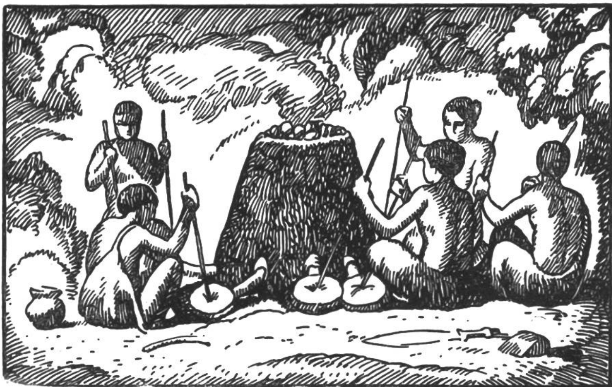
Erzgewinnung in primitivem, mit Blasebälgen angefachtem Ofen.

— Die Töpferei war erfunden. — Noch heute bewundern wir die schönen Formen der ältesten Geschirre.