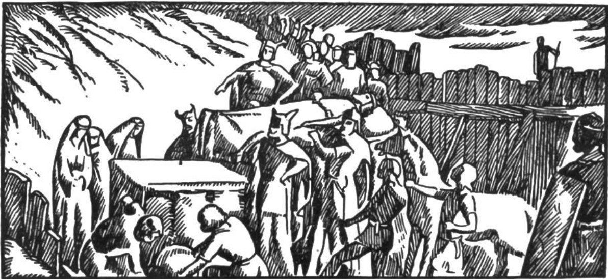
Bestattung Alarichs im Busento.