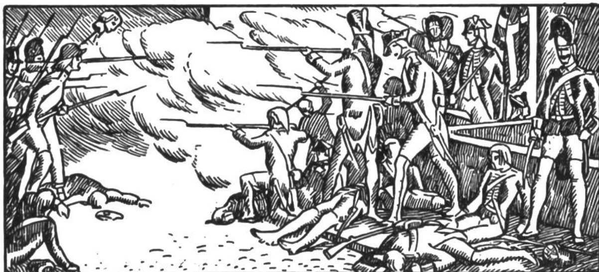
Verteidigung der Tuileries durch die Schweizergarde.