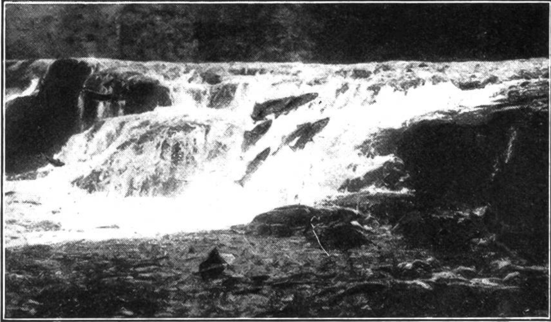
Sorellenzug beim Ersteigen eines Wasserfalles. (Photogr. nach Natur)

durchsichtige Larven, die sich nach und nach zu kleinen Aalen entwickeln. Ein Jahr alt, steigen die Aale mit Überwindung zahlreicher Hindernisse die Flüsse hinauf. Sie klettern über Schleusen und Felsstücke. Bei hohen Dämmen und Wehren sucht man ihre Wanderung durch Anlegen sogenannter Aalbrutleitern zu erleichtern. Es sind dies aus Brettern genagelte, mit niedrigen Querleisten versehene Rinnen, die nach dem höheren Wasserspiegel führen. In großen Scharen klimmen die jungen, schlangenähnlichen Fische diese Saumpfade empor. Im Laufe ihres 3—4jährigen Aufenthaltes in den Binnengewässern erreichen die Aale eine stattliche Größe; sie werden bis 1 m lang und 8 kg schwer; ausgewachsen, begeben sie sich auf die Rückwanderung nach dem Meere. Unterwegs werden die Heimkehrenden zu Hunderttausenden erbeutet. In den Lagunen bei der Po-Mündung drängen sich die Aale manchmal in solchen Scharen in die zum Sang angelegten Schleusen, daß das Wasser keinen Platz mehr hat und die aufzugartigen Hebevorrichtungen nicht schnell genug arbeiten. Dann werden am hinzuführenden Kanal Feuer angezündet, um den Zuzug ins Stoßen zu bringen.