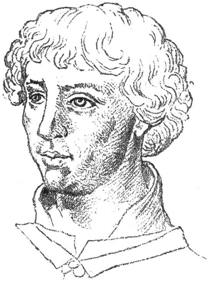
Karl der Kühne von Burgund. Zeitgenössische Zeichnung. Museum Arras.

beschlagen und mit Eisenzaden versehen waren. Die Menge der übrigen Waffen, wie Piken, Schwerter, Armbruste, Streitärte usw., war unermesslich. Unter anderm fand man auch ein Faß voll Stricke mit zulaufenden Schlingen, wahrscheinlich zu demselben Gebrauche bestimmt, den der Herzog bei der Besatzung von Grandson damit machte; andere Fässer enthielten Pfeile aus englischer Fabrik, ein Teil davon war vergiftet.