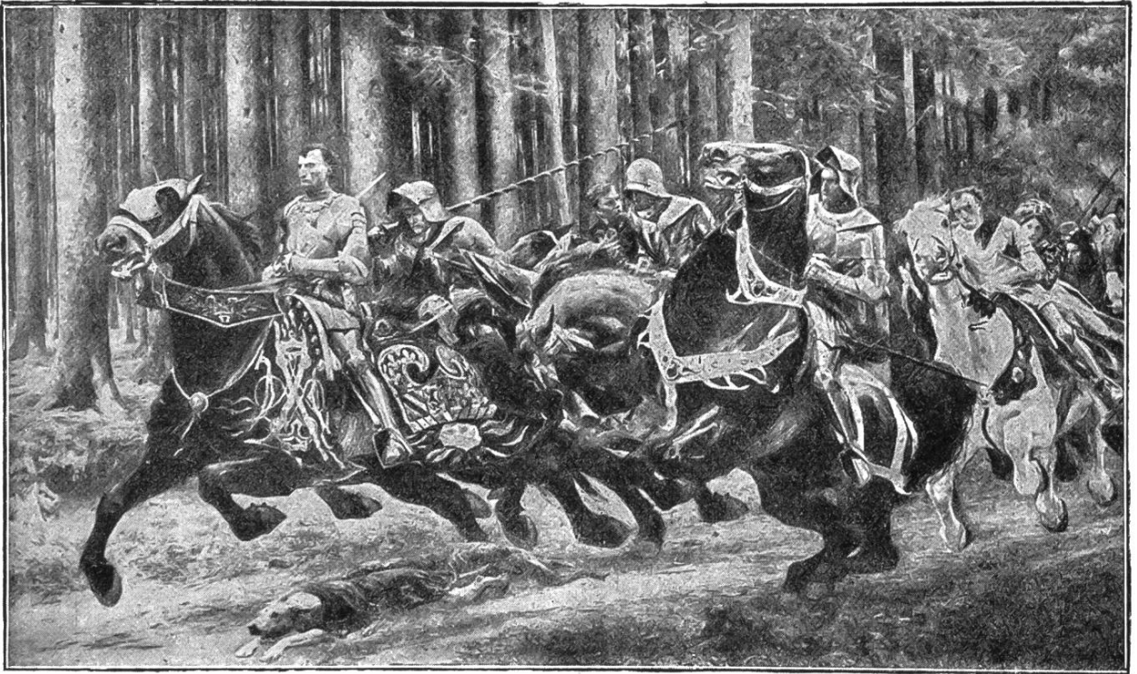
Die Flucht Karls des Kühnen. Gemälde von Eugène Burnand. Gott- fried-Keller-Stiftung, Museum Lausanne.