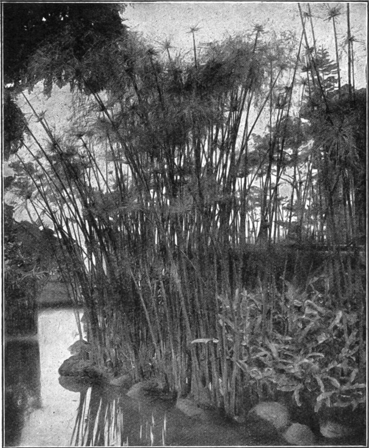
Die „Papyrus“ = Pflanze, die unserem Schreibpapier den Namen gab und die schon vor 5000 Jahren den Ägyptern das Rohmaterial zu ihren Schreibrollen lieferte.