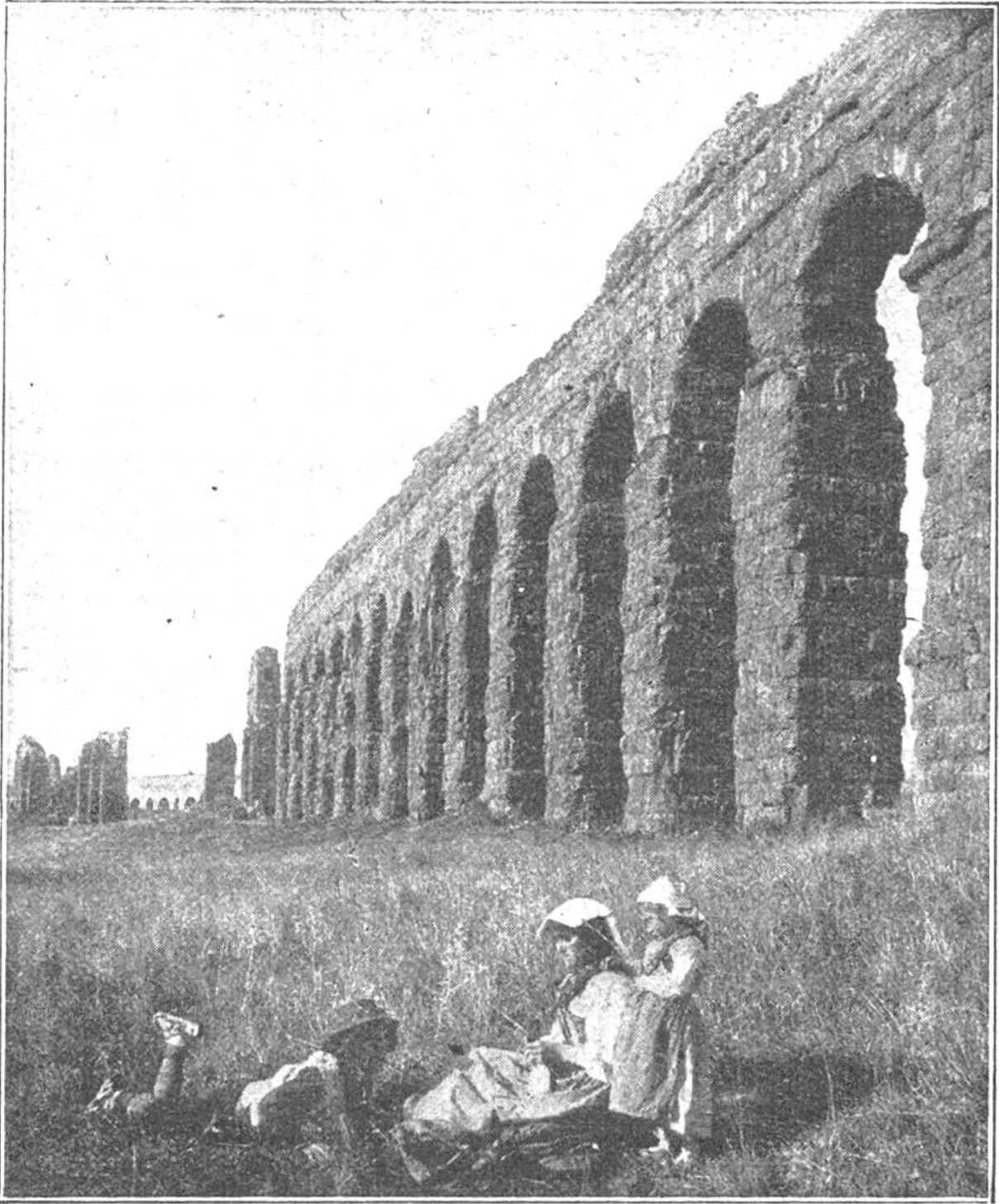
Aquädukt in der römischen Campagna; ein Wahrzeichen aus der Glanzzeit des alten Rom.