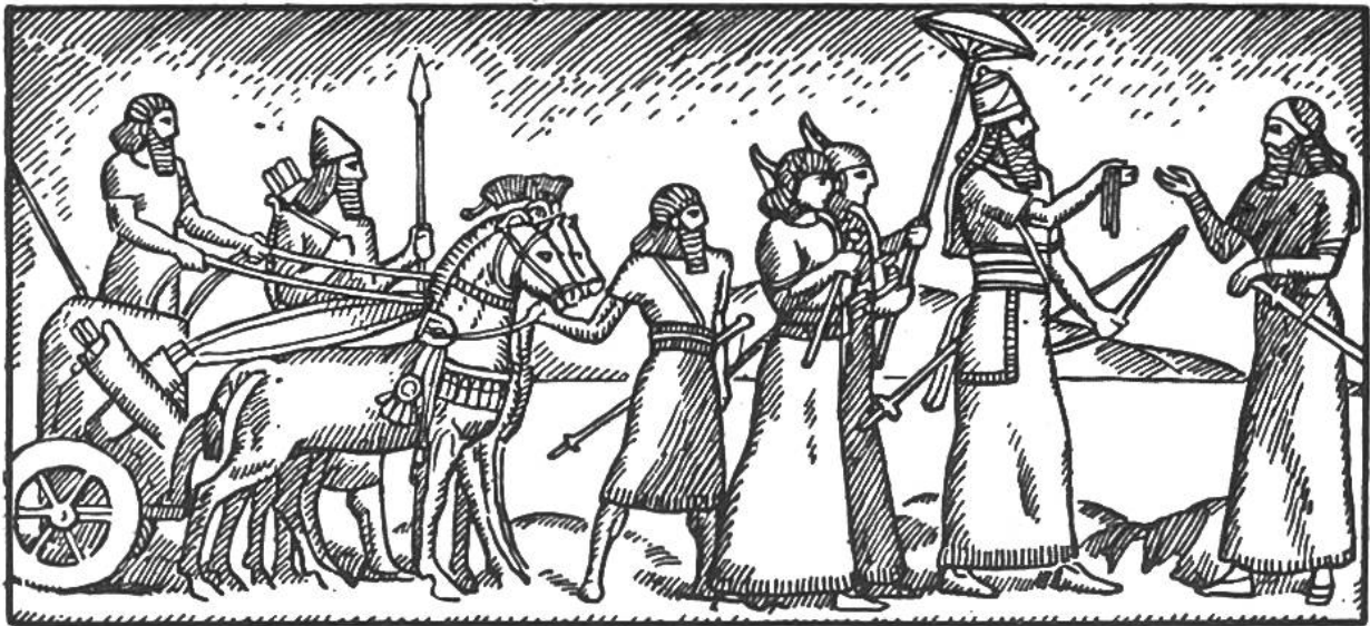
Assyrischer König mit Gefolge.