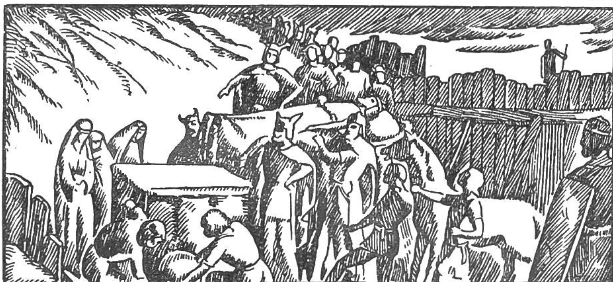
Bestattung Alarichs im Busento.