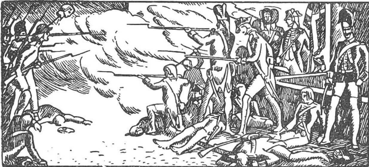
Verteidigung der Tuilerien durch die Schweizergarde.