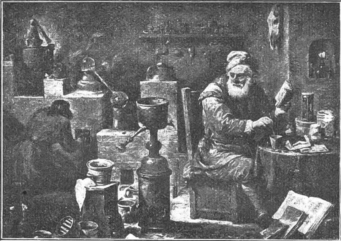
„Ein Alchimist.“ Gemälde von David Teniers, d. J., Antwerpen. 1610—1690.