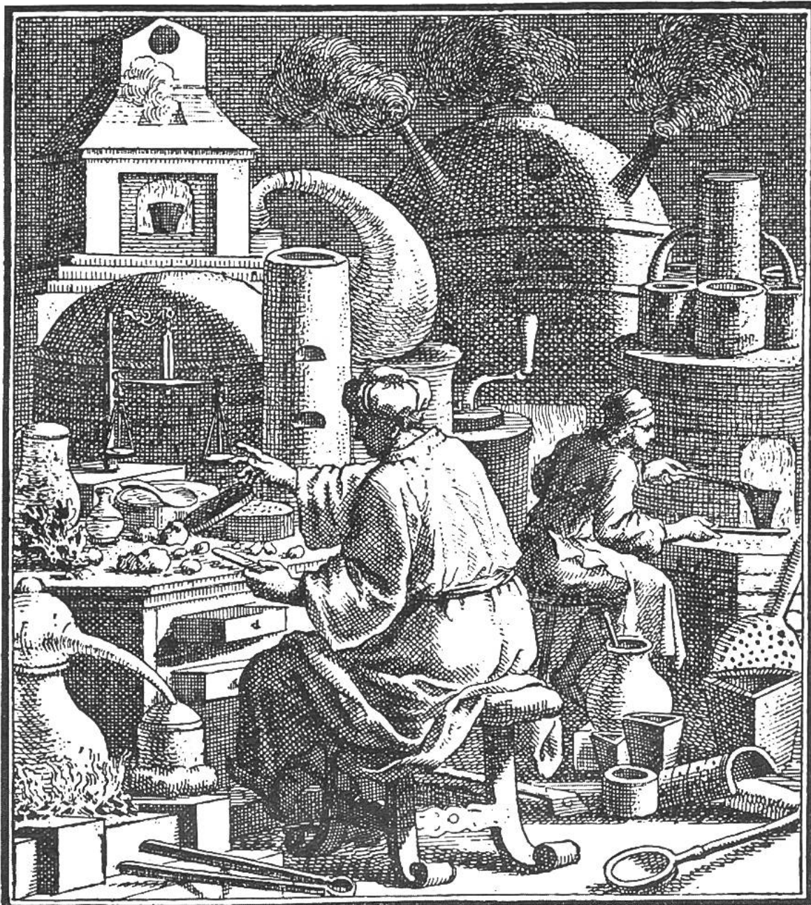
Der Goldmacher in seiner Behausung, umgeben von phantastisch geformten Gefäßen

gereien Eingang in die Alchimie. Fürstliche Herren suchten ihren durch Mißwirtschaft und Verschwendung bedrohten Haushalt auf bequeme Art wieder herzustellen, indem sie selbst zur Goldbeschaffung Alchimie betrieben oder Leute anstellten, die sich „Alchimisten“ nannten, gewöhnlich aber abgefeymte Betrüger waren.