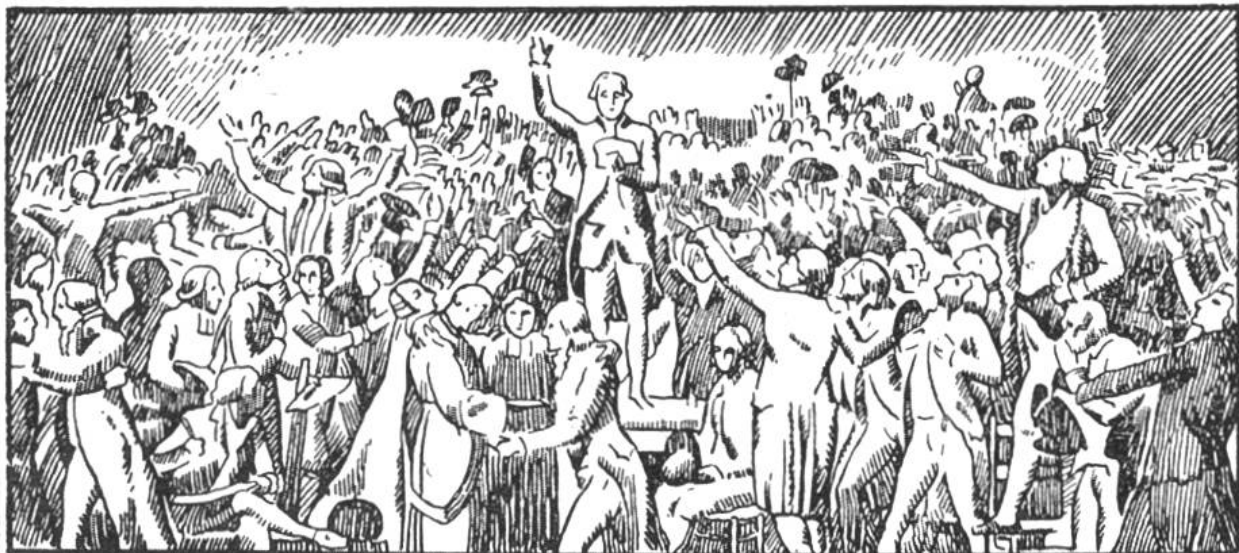
Der Schwur im Ballspielhause am 20. Juni 1789.