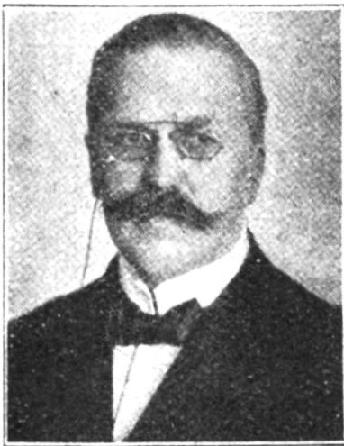
Edm. Schulthess von Brugg * 1868, seit 1912 i. Amte

Dr. Motta: Chef d. Po- litischen Departements. Dr. Chuard: Chef d. De- partements des Innern. Häberlin: Chef d. Justiz- u. Polizeidepartements. Scheurer: Chef des Mi- litärdepartements. Dr. Musy: Chef des Finanz- und Zolldepartements. Schulthess: Chef d. Volks- wirtschaftsdepart. Dr. Haab: Chef d. Post-u. Ei- senbahndepartements.