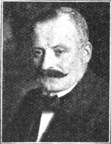
Dr. Giuseppe Motta von Airolo * 1871, seit 1912 i. Amte