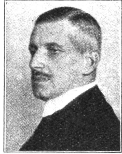
Dr. Robert Haab von Wädenswil * 1865, seit 1918 i. Amte