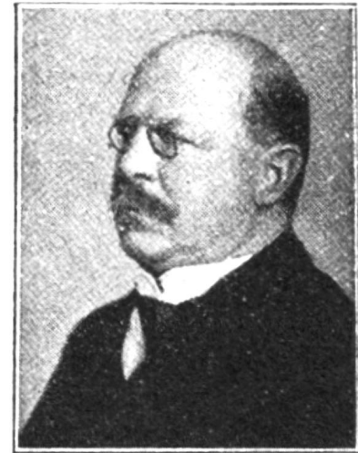
Karl Scheurer von Erlach * 1872, seit 1920 i. Amte

Dr. Motta: Chef d. Po- litischen Departements. Dr. Chuard: Chef d. De- partements des Innern. Häberlin: Chef d. Justiz- u. Polizeidepartements. Scheurer: Chef des Mi- litärdepartements. Dr. Musy: Chef des Finanz- und Zolldepartements. Schulthess: Chef d. Volks- wirtschaftsdepart. Dr. Haab: Chef d. Post-u. Ei- senbahndepartements.