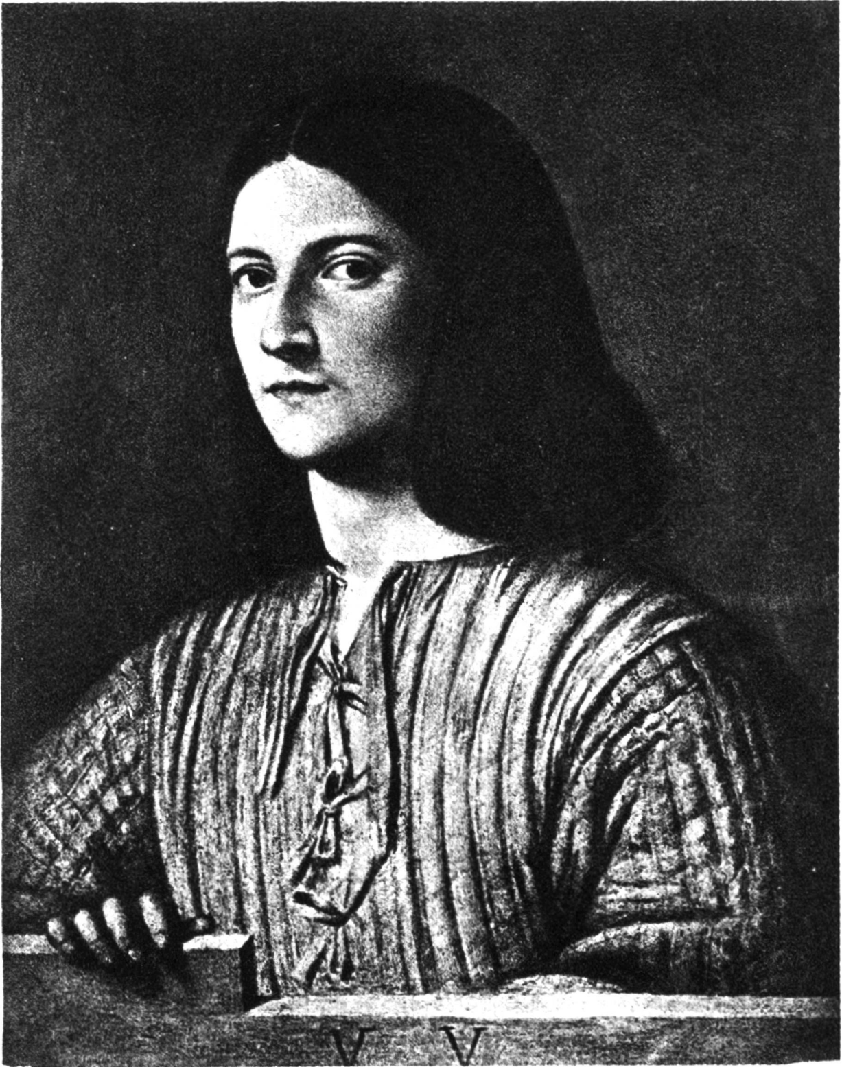
Junger Mann, von Giorgione, Venedig, 1478 - 1511. Kaiser Friedrich - Museum, Berlin.