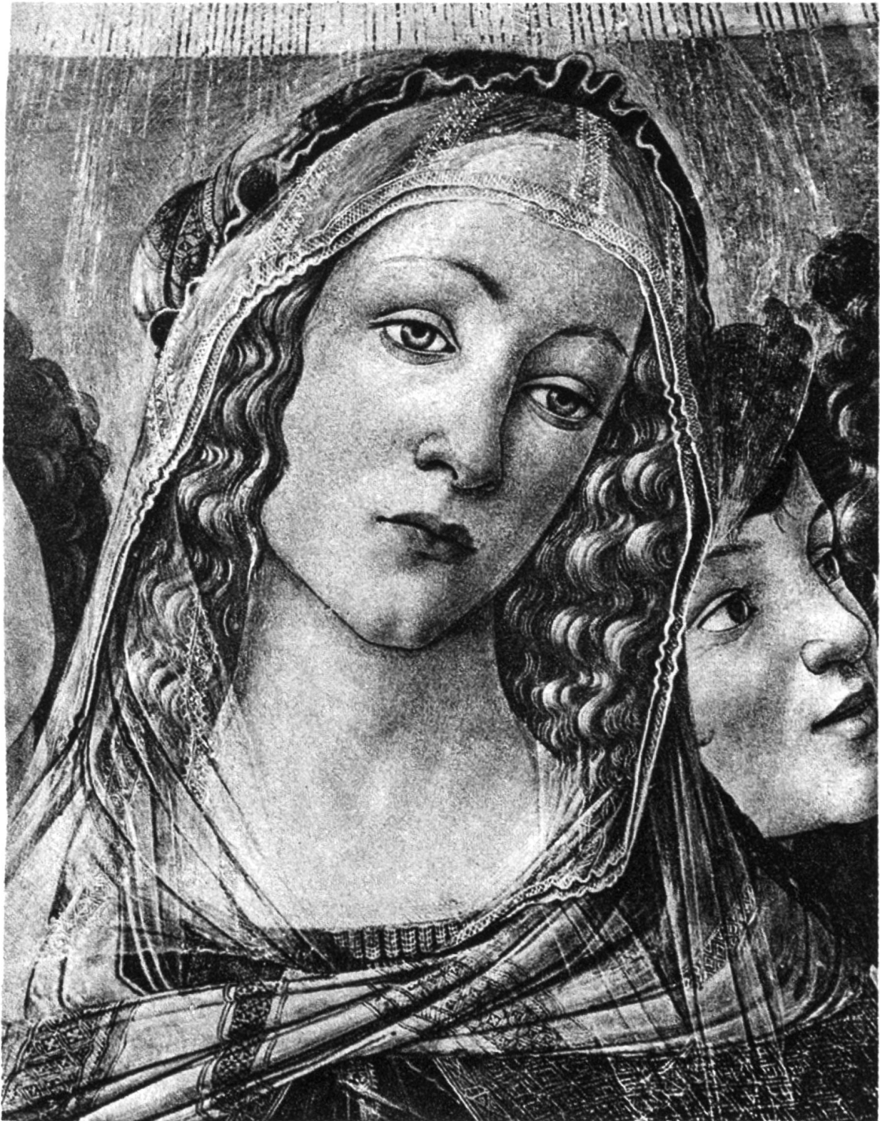
M a r i a, Teilstück aus dem Gemälde „Die Madonna mit dem Granatapfel“, von Sandro Botticelli, Florenz, 1443-1510. Uffizien, Florenz.