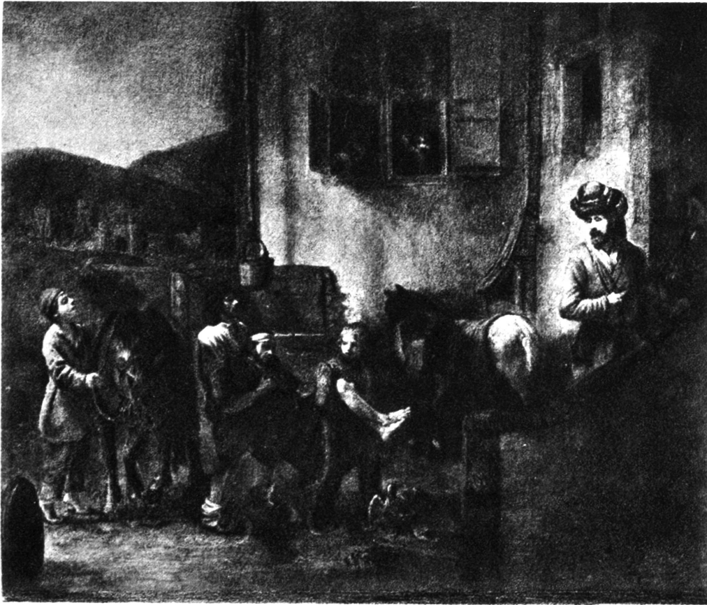
Der barmherzige Samariter, von Rembrandt van Rijn, Amsterdam, 1606 — 1669. Museum Louvre, Paris.