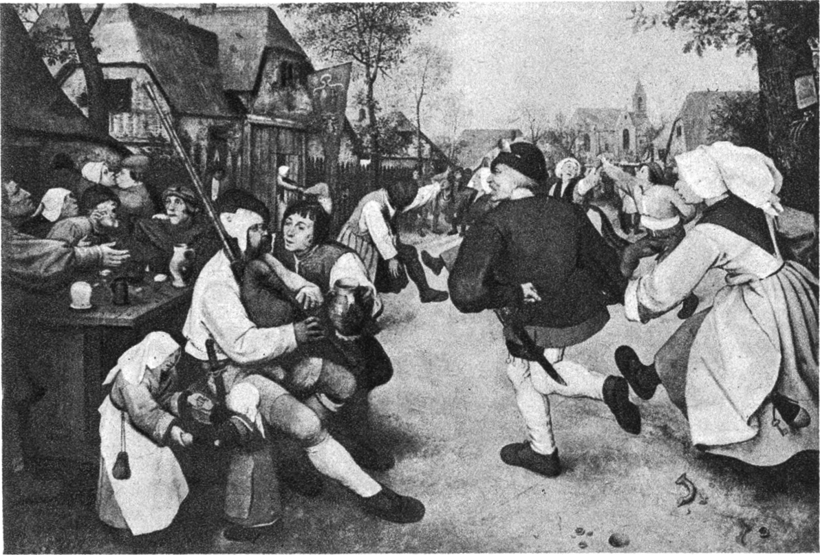
Kir ch we ih, v. Pieter Breughel d. Aelt. (Bauernbreughel), Antwerpen, 1525-1569. Hofmuseum, Wien.