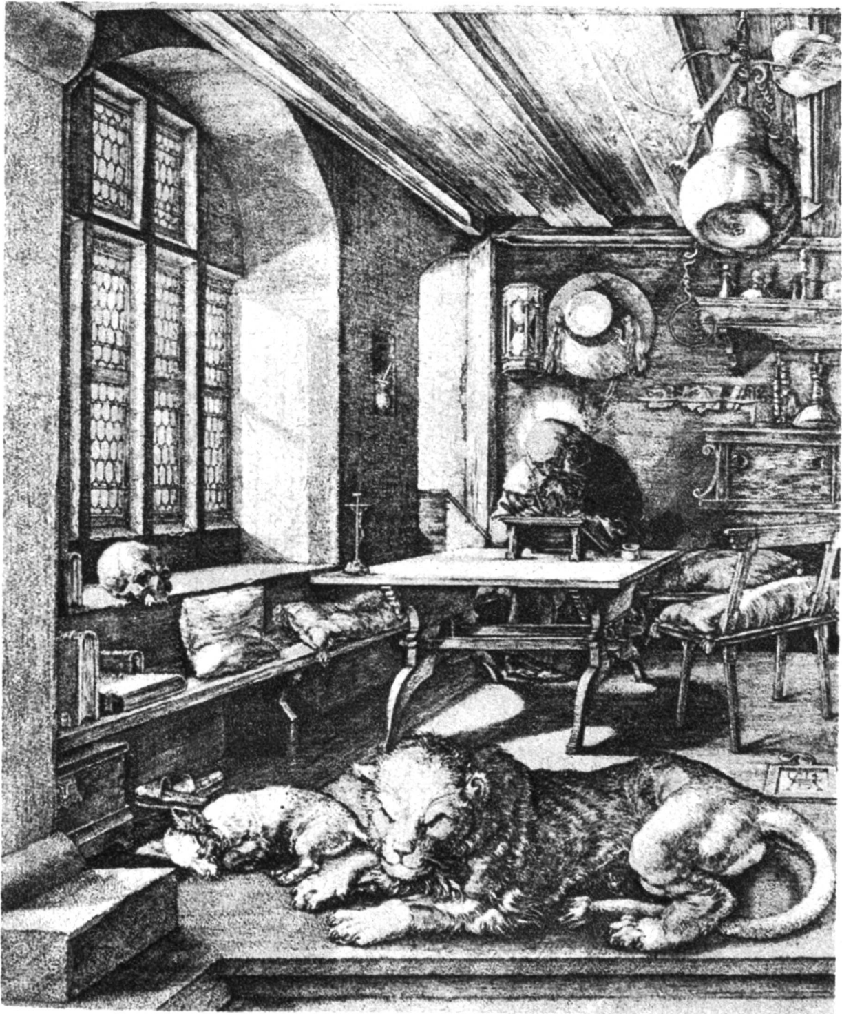
Hieronymus in der Zelle. Kupferstich von Albrecht Dürer, Nürnberg, 1471 - 1528.