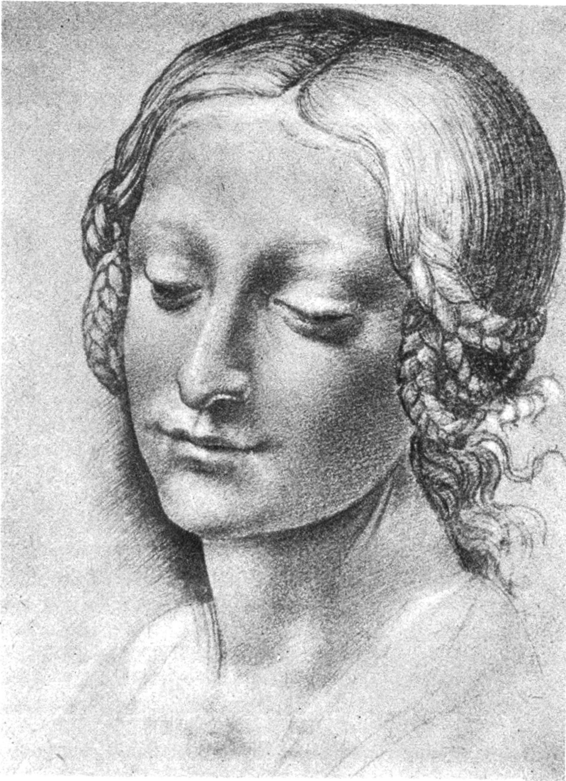
Studienkopf, von Leonardo da Vinci, Florenz, 1452 - 1519. Ambrosiana, Mailand.