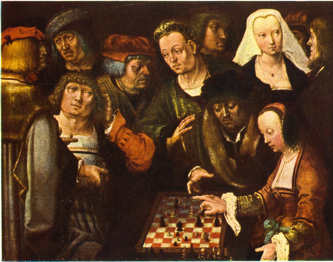
SCHACHPARTIE Lukas van Leiden 1494 — 1533. Berliner Museum : : : : : :