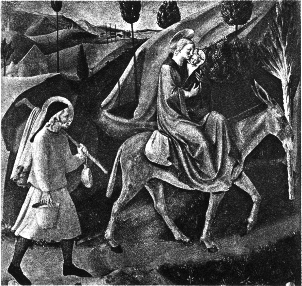
Die Flucht nach Aegypten, von Beato Angelico, Rom, 1387-1455. Wandgemälde im Dominikanerkloster San Marco, Florenz.