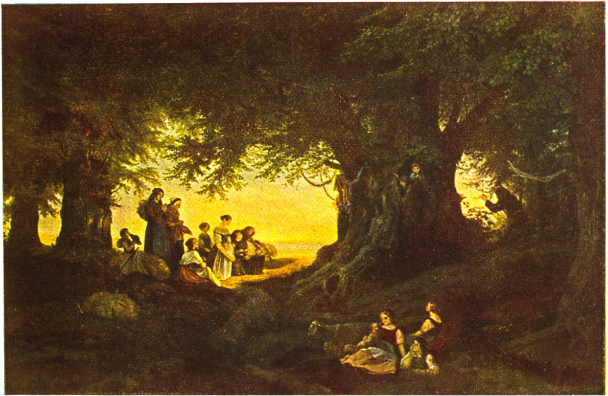
A B E N D L Ä U T E N Ludwig Richter, Dresden 1803—1884, Museum Leipzig