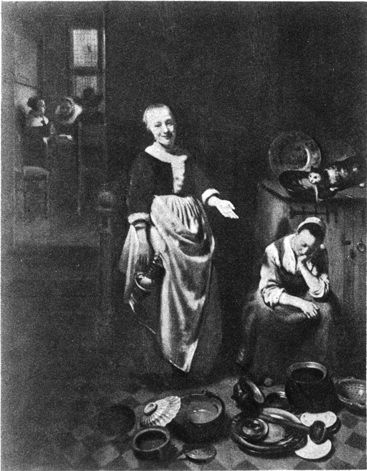
Die träge Magd, von Nicolas Maes, Amsterdam, 1632 — 1693. Nationalgalerie, London.