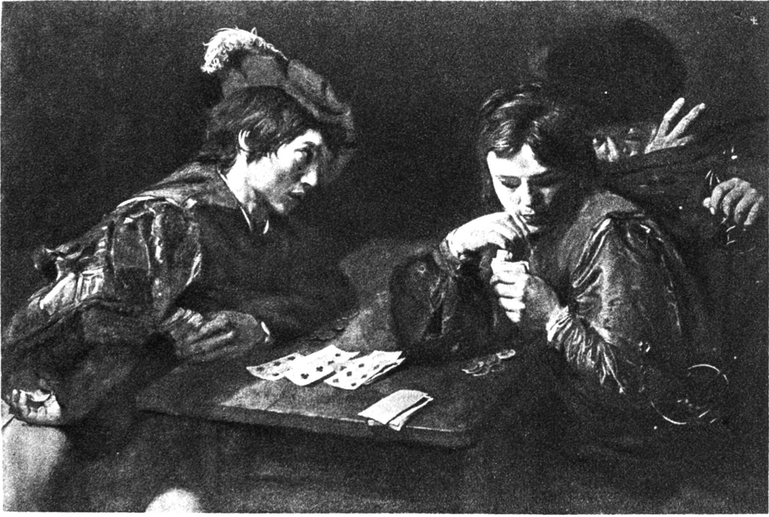
Der Falschspieler, von Michel Angelo Caravaggio, Rom, 1569-1609. Gemäldegalerie, Dresden.