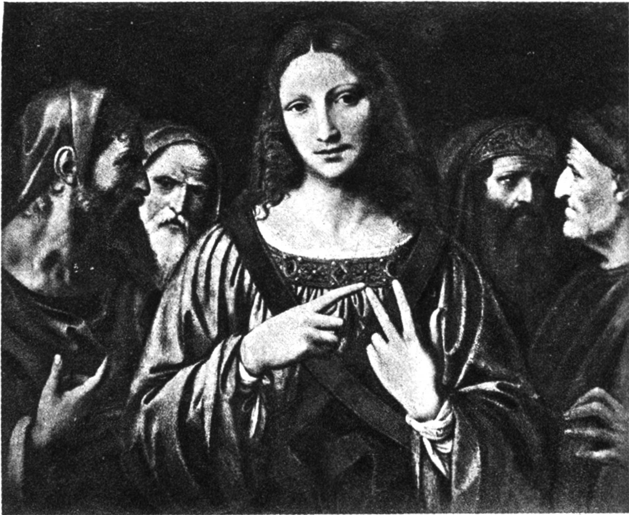
Christus bei den Schriftgelehrten, von Bernardino Luini, Luino, 1475-1533. Nationalgalerie, London.