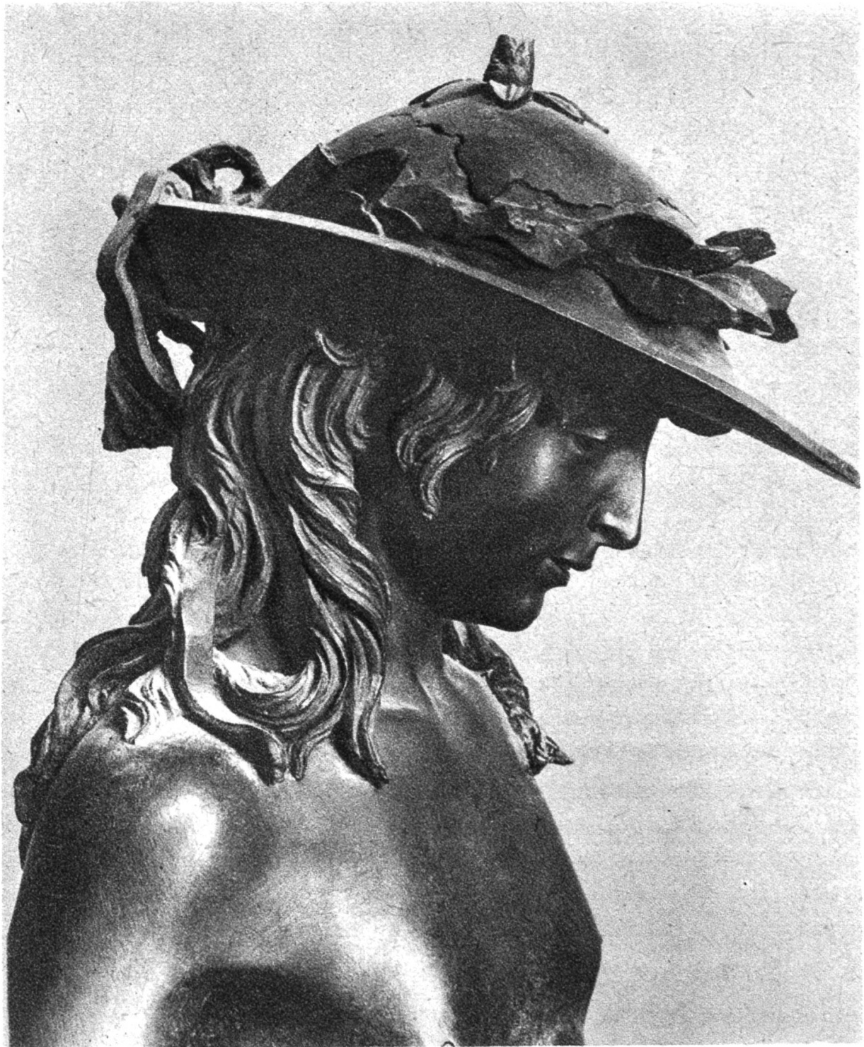
Kopf des David, Teilstück der Bronzestatue von Donatello, Florenz, 1386-1466. Nationalmuseum, Florenz.