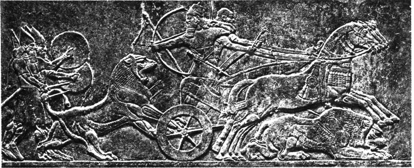
Assyrische Kunst. König Assur-nasir-pal auf der Löwenjagd. Steinrelief aus dem 9. Jahrhundert vor Christi Geburt. Im Britischen Museum in London.