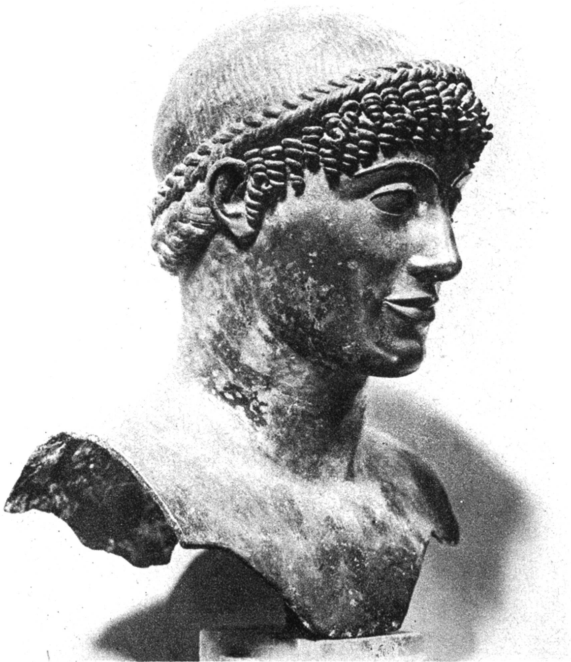
Griechische Bronzebüste, aus dem 4. Jahrhundert vor Christi Geburt. Nationalmuseum in Neapel.