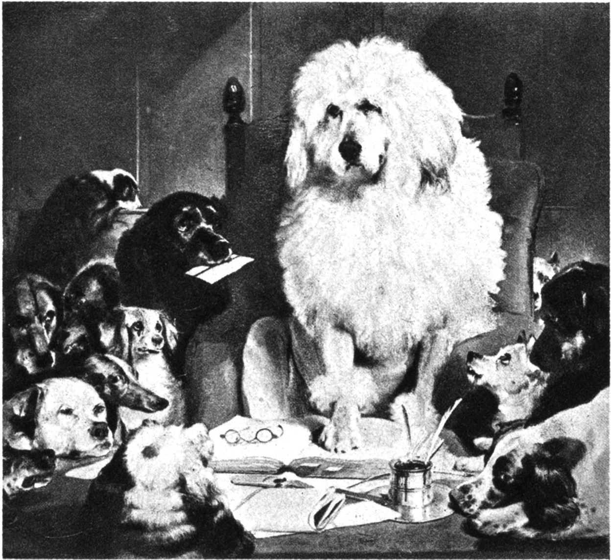
Die Hunde sitzen zu Gericht, von Edwin Landseer, London, 1802 - 1873. Nationalgalerie, London.