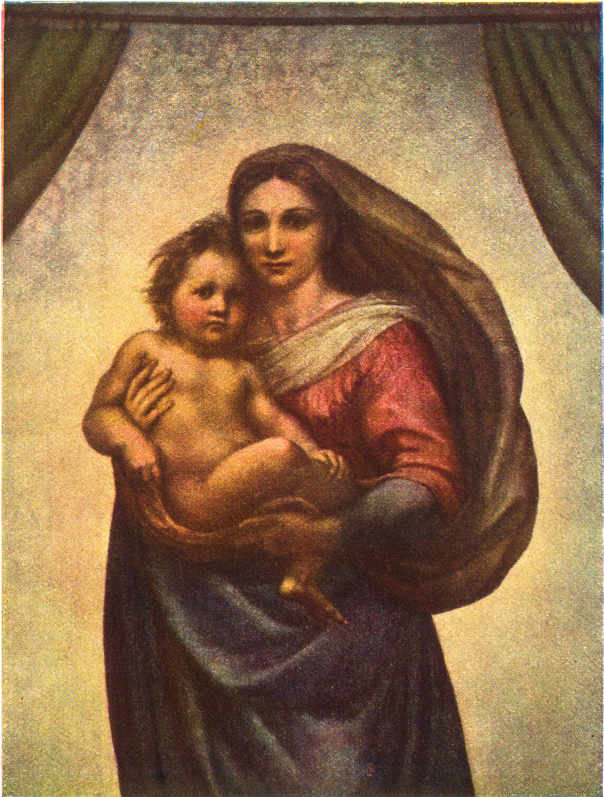
MARIA MIT DEM JESUSKIND Teilstück aus der „Sixtinischen Madonna“ von Raffael, Rom 1483 — 1520. Dresdener Galerie