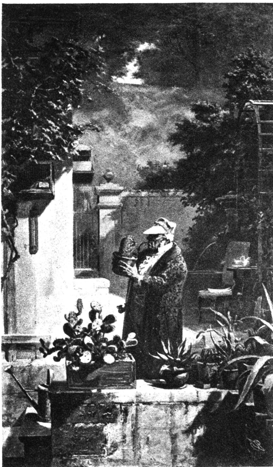
Der Kakteenfreund, von Karl Spitzweg, München, 1808-1885. Galerie Lichtenstein, Wien.