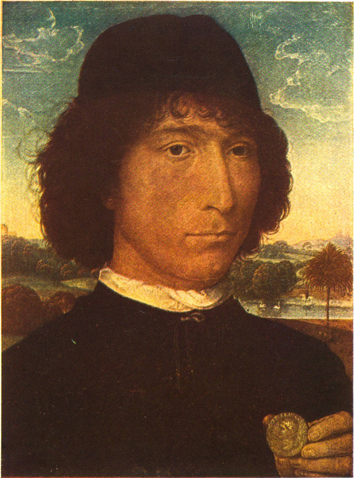
M A N N M I T M Ü N Z E Hans Memling, Brügge, 1440—1494, Museum Antwerpen