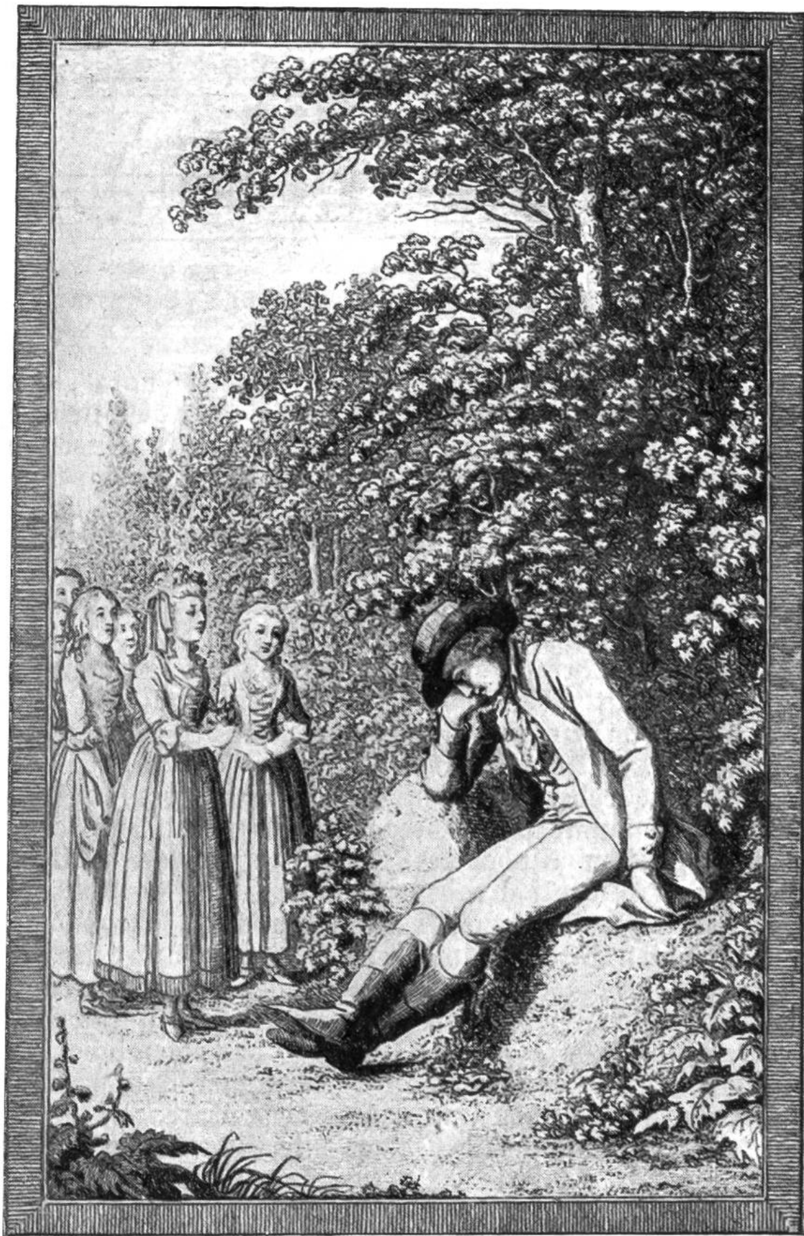
Die Spinnerfinder kommen, dem Junker mit Sreuden zu danken für die erwiesenen Guttaten.