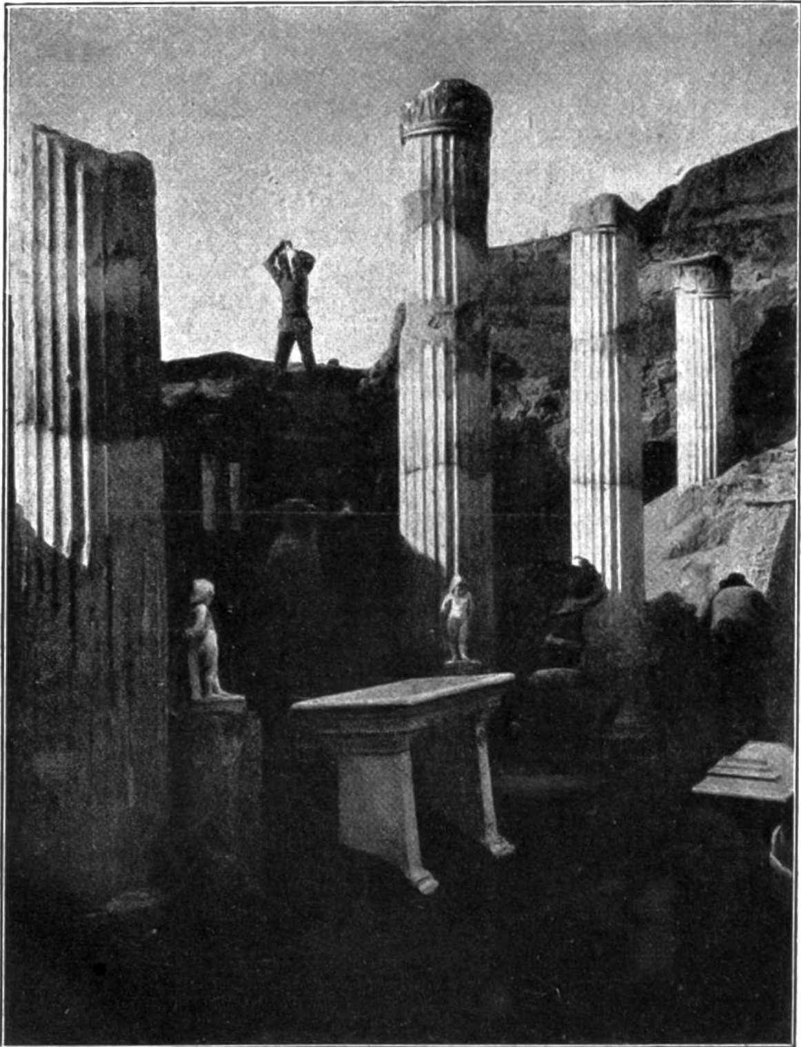
Ausgrabungsarbeit in Pompeji. In Körben wird die 6 Meter hohe Schicht aus Asche und Bimssteinbroden weggeschafft. Das Bild zeigt, wie ein Teilstück des „Hauses Vetti“, das auf unserer ersten Abbildung im jetzigen Zustande zu sehen ist, freigelegt wurde.