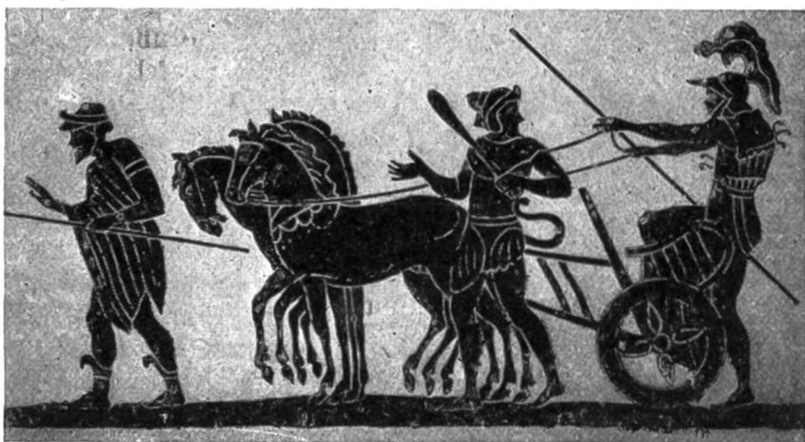
Etruskischer Krieger besteigt einen Streitwagen (ca. 7. Jahrh. v. Chr.).

Auch öffentliche Gebäude verschiedenster Art, mehrere Tempel, ein Theater mit 5000 Plätzen, eine Markthalle, eine Kaserne und große Badanstalten sind freigelegt worden. Die Ausgrabungsarbeiten sind noch lange nicht beendigt; sie werden jetzt viel sorgfältiger vorgenommen als früher. Um Einstürze verkohlten oder morschen Gebäudes zu vermeiden, wird die Aschenmasse schichtweise abgetragen, und alles, was einzubrechen droht, wird sofort durch neue Balken und Träger gestützt. Wohl ist diese Art der Freilegung schwieriger und langsamer, doch alles auf diese Weise Ausgegrabene vermag uns ein noch viel getreueres Bild vom einstigen Pompeji zu vermitteln. B.K.