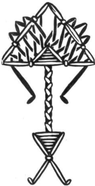
Vorlage zur Stiche- rei auf der Weste Modell B.

Don hier spitzt man den Daumen in 5 Runden durch Zusammenstricken der Maschen zu und zieht die übrigen Maschen zusammen. Nun nimmt man die neu aufgeschlagenen 10 Maschen zu den übrigen hinzu und strickt 26 Runden. In weitem 10 Runden sind, wie beim Daumen, Maschen abzunehmen und zusammenzuziehen. Zwischen dem braunen Bördchen wird eine Zickzacklinie mit roten Maschenstichen eingenäht.