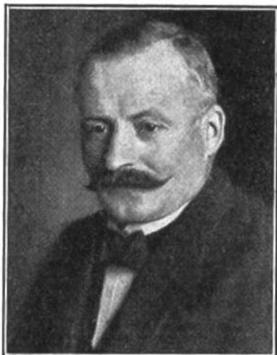
Dr. Giuseppe Motta von Airolo * 1871, seit 1912 i. Amte