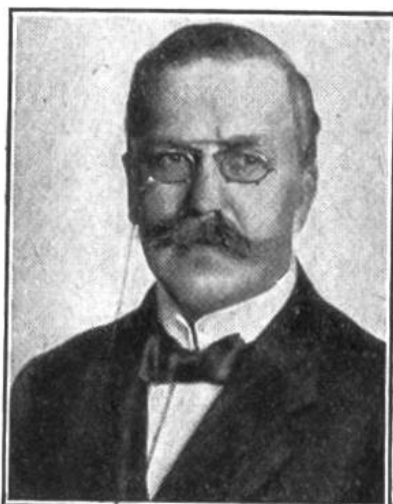
Edmund Schultheß von Brugg * 1868, seit 1912 i. Amte

Dr. Motta: Chef d. Po- litischen Departements. Dr. Chuard: Chef d. De- partements des Innern. Häberlin: Chef d. Justiz- u. Polizeidepartements. Scheurer: Chef des Mi- litärdepartements. Dr. Musy: Chef des Finanz- und Zolldepartements. Schultheß: Chef d. Volks- wirtschaftsdepart. Dr. Haab: Chef d. Post-u. Ei- senbahndepartements.