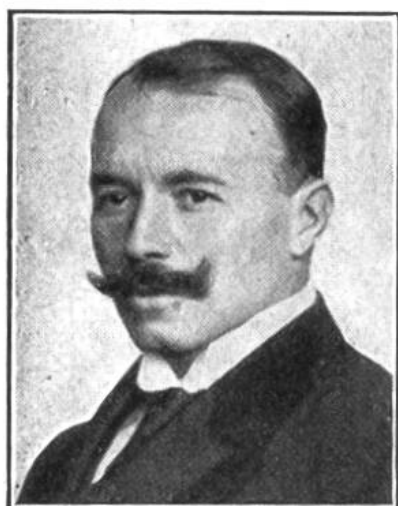
Dr. Jean Musy von Albeuve, Freiburg * 1876, seit 1920 i. Amte