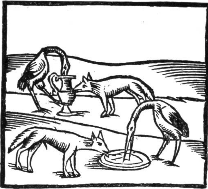
„Ein Fuchß der bat ein Storch zu dem Nachtmal.“