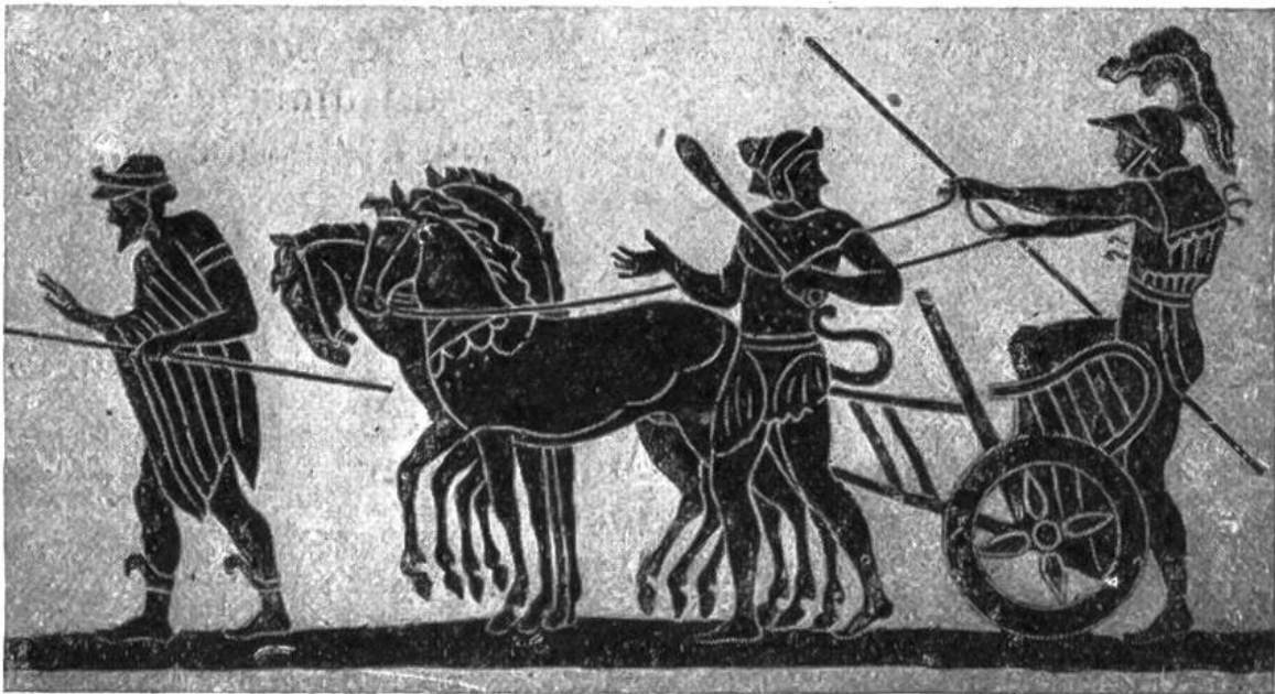
Etruskischer Krieger besteigt einen Streitwagen (ca. 7. Jahrh. v. Chr.).

Auch öffentliche Gebäude verschiedenster Art, mehrere Tempel, ein Theater mit 5000 Plätzen, eine Markthalle, eine Kaserne und große Badanstalten sind freigelegt worden. Die Ausgrabungsarbeiten sind noch lange nicht beendet; sie werden jetzt viel sorgfältiger vorgenommen als früher. Um Einstürze verfallenen oder morschen Gebäudes zu vermeiden, wird die Aschenmasse schichtweise abgetragen, und alles, was einzubrechen droht, wird sofort durch neue Balken und Träger gestützt. Wohl ist diese Art der Freilegung schwieriger und langsamer, doch alles auf diese Weise Ausgegrabene vermag uns ein noch viel getreueres Bild vom einstigen Pompeji zu vermitteln. B.K.