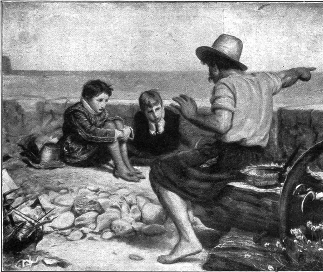
Walter Raleigh und der Matrose (Gemälde von Millais). Der junge Raleigh und einer seiner Freunde lauschen gespannt einem Seemann, der ihnen von dem noch wenig erforschten Erdteil Amerika erzählt der 70 Jahre früher entdeckt worden war.