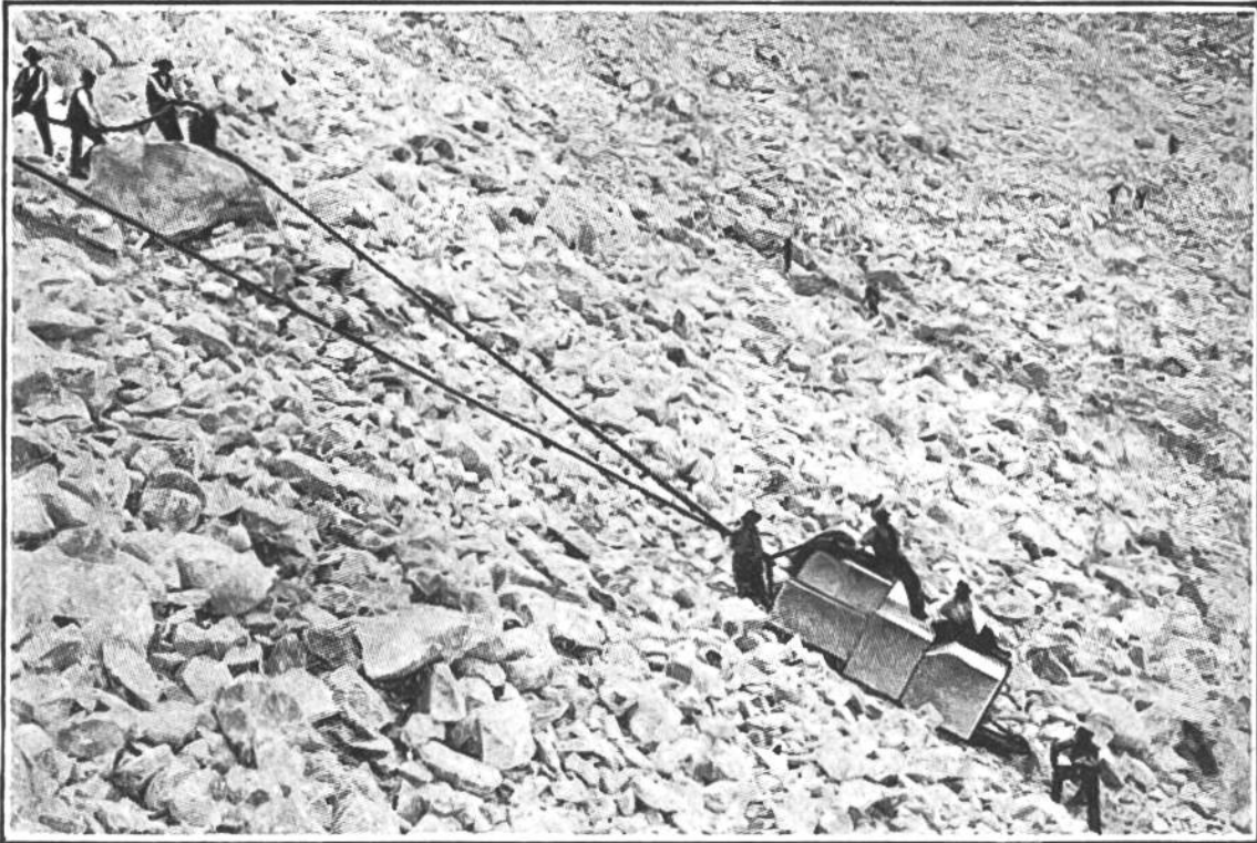
Auf Rollen werden die Marmorblöcke über die Halden hinuntergelassen.