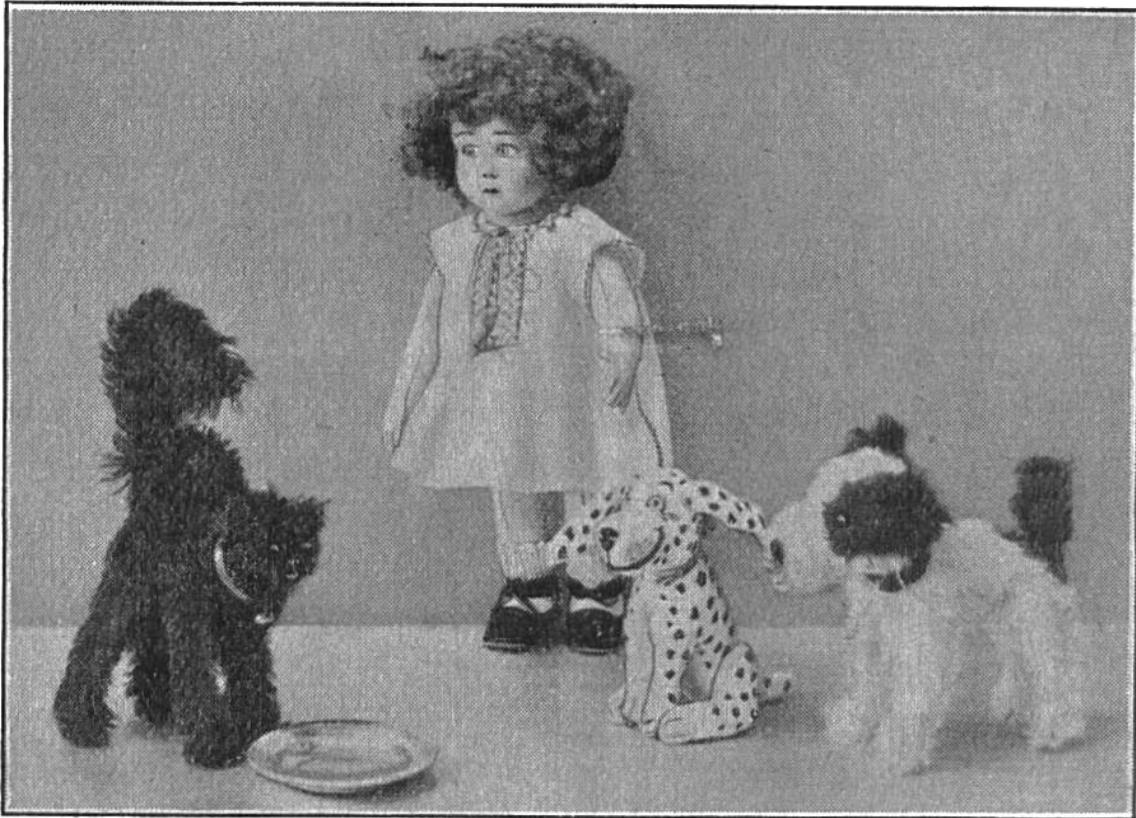
K ä t h e in m i t t e n i h r e r L i e b l i n g e .