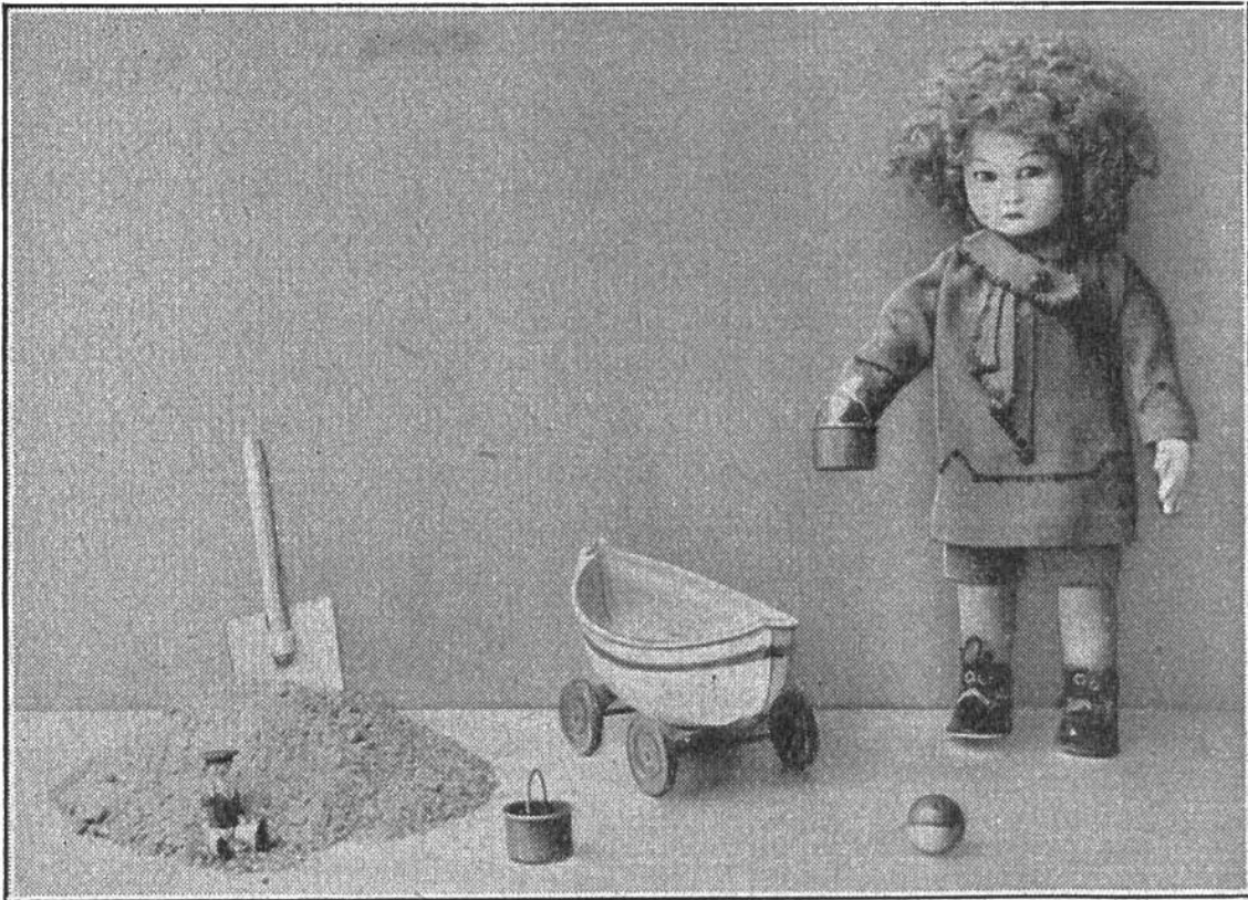
Peter ist emsig „an der Arbeit“.

auf doppelten Stoff gelegt, um gleich zwei Ärmel und die linke und rechte Seite der Höschen zu erhalten. — Die Achsel- und Seitennähte und auch die Nähte der hinteren und vorderen Mitte der Höschen bügelt man auseinander und übernäht sie. — Der Rand des Höschens und des Bluschens wird gesäumt.