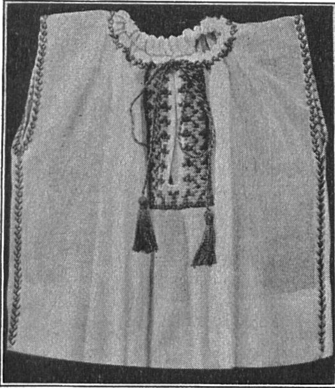
Ein duftiges Röckchen für die heissen Tage.

Armloch beträgt auf die Hälfte 6,5 cm. Als Garnitur wird auf der Naht der Bäumchenstich ausgeführt; man beginnt unten beim Armloch. Der Halsausschnitt wird eingezogen. Bevor das Bündchen aufgeheftet wird, soll die Garnitur (der Bäumchenstich) auf das eingeschlagene Bündchen gearbeitet werden. Hier beginnt man in der Rückenmitte. So-