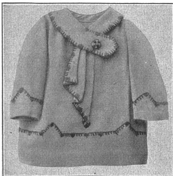
Ein schmucker Kittel.

Der Kragen wird in den Halsausschnitt eingesetzt und innen mit Knopflochstich ausgenäht. — Zum Schliessen