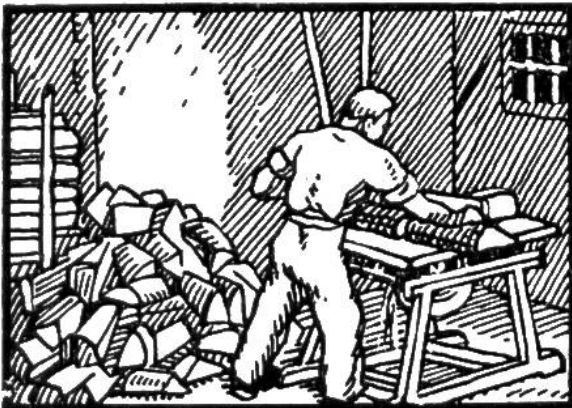
2\frac{1}{2} Ster Buchenholz viermal schneiden.