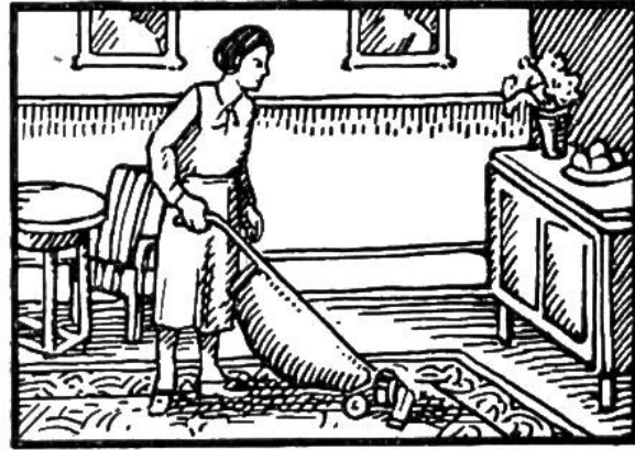
Einen gewöhnlichen Staubsauger 5-8 Stunden benutzen.