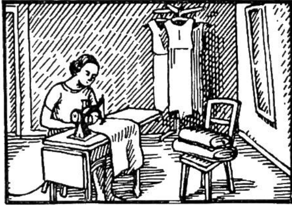
Eine Nähmaschine zehn Stunden lang betreiben.