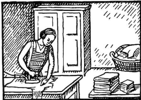
Während 2\frac{1}{2} Stunden bügeln.