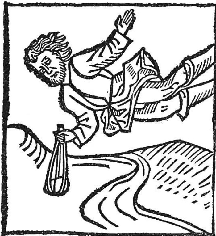
Die Gewalt einer Windhose hebt einen Mann in die Lüfte. (Nach einem Holzschnitt des Mittelalters.)

Tageszeiten herein. Noch leben in der Erinnerung die Schreckendesfürchterlichen Wirbelsturmes vom Jahre 1925 fort. Der Tornado raste damals in einer Bahn von 350 km Länge und 1,6 km Breite über das Land hin. 792 Menschen brachten den Tod; 3000 wurden verletzt. Der Schaden an Hab und Gut, Vieh und Ware wurde auf annä-