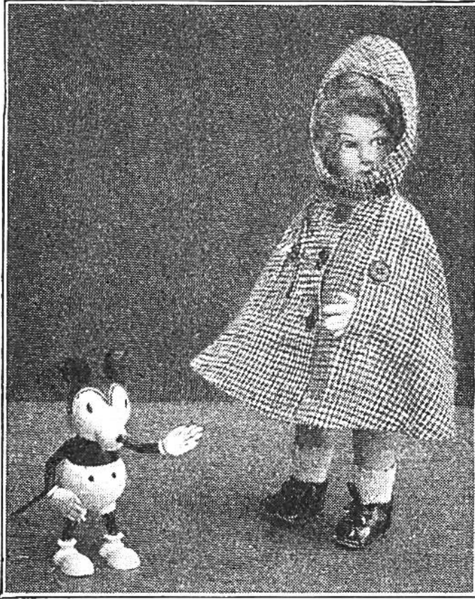
Ob's regnen wird?

Erst führt man an d. Vorderteilen beidseitig von \times bis \times einen Einschnitt aus, dessen vorderer Rand mit einem geraden Stoffstreifen einzufassen ist. Dem rückwärtigen Einschnitttrand stürzt man von der linken Seite die Schlitzpatte an, legt sie in der Hälfte der Breite zusammen und steppt sie auf der rechten Seite schmalkantig auf. Die der vorderen Mitte angeschnitte-