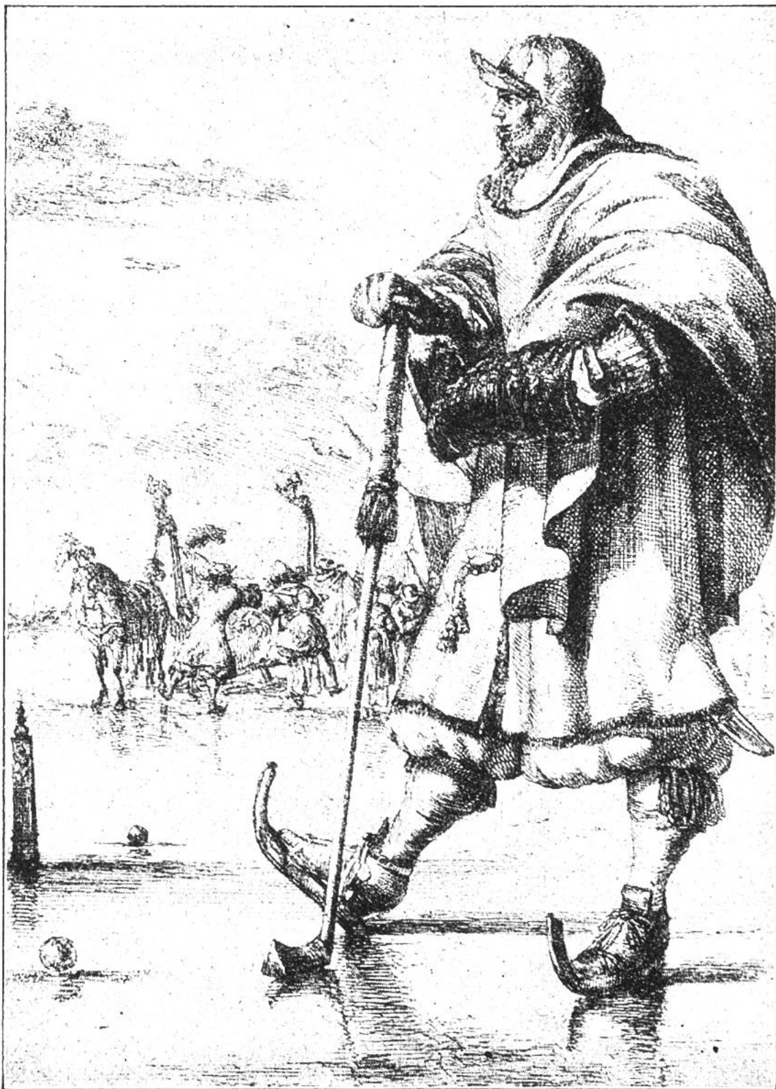
Holländer in malerischer „Sporttracht“ bei einem hockey- oder polo-ähnlichen Spiel auf dem Eise. (Nach einem Stich Romeyn de Hooghes vom Jahre 1675.)