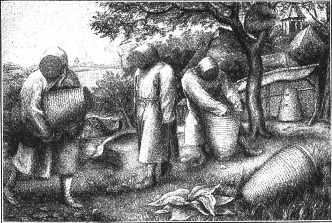
Bienenzüchter, vorzüglich geschützt durch Mantel, Maske und Kapuze, an der Arbeit. (Nach einer Zeichnung von Pieter Brueghel, aus dem Jahre 1561.)

ohne Gefahr bemächtigen und zugleich auch verhüten, dass sich die Tierchen selber über ihr rechtmässiges Eigentum, den köstlichen Seim, hermachten.