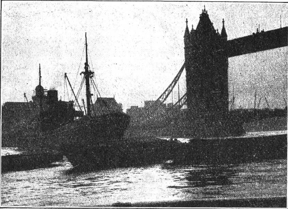
Morgen an der Themse. Bildausschnitt aus dem Londoner Hafen bei der Tower-Brücke.