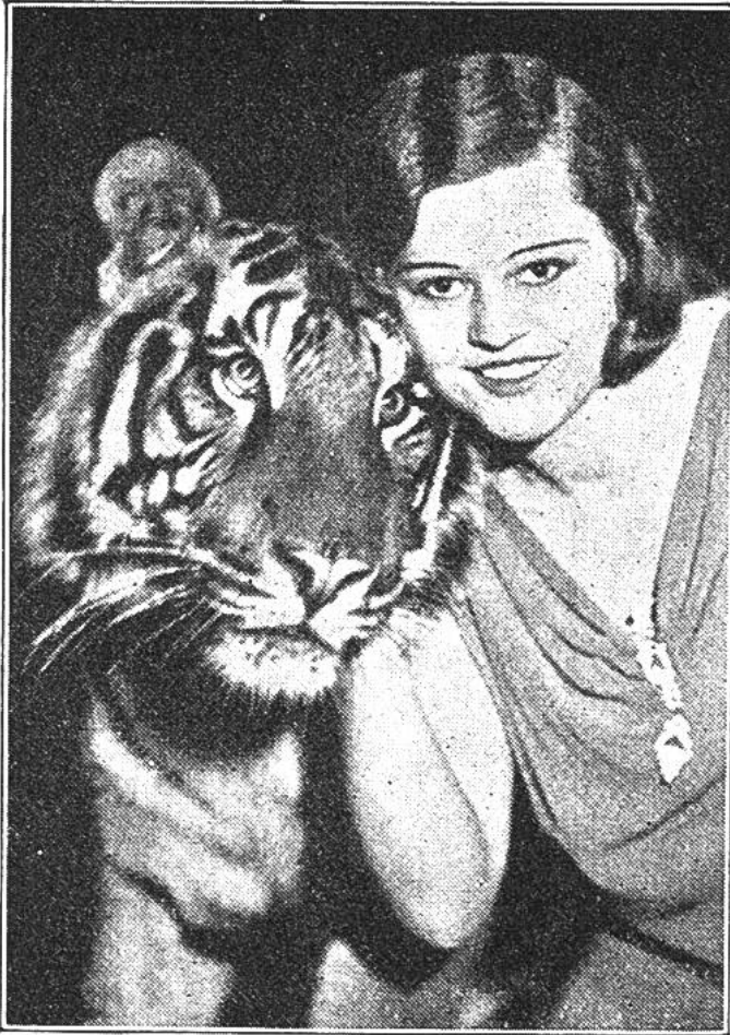
Bildnis zweier guter Freunde. Auch der Tiger hat ein Gefühl dafür, wer es gut mit ihm meint.

ihm etwa ein wenig den unmittelbaren Zusammenhang mit der Natur zu ersetzen oder vielleicht auch noch der Zirkus, dessen Anwesenheit allemal ein grosses Ereignis darstellt für jung und alt. Da gibt es nicht bloss Dinge, an denen sich die Schaulust und die Wissbegierde erlaben können. Wer besser beobachtet und alles, was er sieht, auch überdenkt, der wird die Feststellung machen, dass manches Tier, das sonst als unberechenbar, heimtückisch und gefährlich verschrien ist, der Freundschaft wohl fähig ist, der Freundschaft zu seinem Meister. Aber dieser Meister muss auch danach sein. Immer mehr verschmähen es heutzutage die Tierbändiger, mit Peitschenhieb und Pistolengeknall die wilden Kinder der Natur einzuschüchtern,