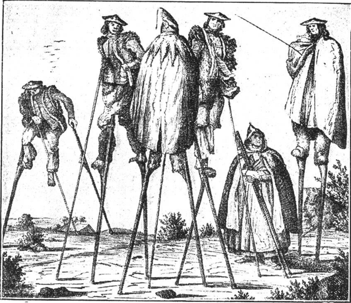
Stelzenlaufen in der Gascogne. (Nach einer Darstellung aus dem Jahre 1836.)

staltet, und zwar unter der Leitung von Lehrern und Schulbehörden. Jedenfalls eilen die Jungen von Inglewood im Stelzschrift nicht weniger flink und gewandt als die Bewohner des französischen Departements der Landes, die einmal vor mehr als hundert Jahren einen königlichen Besuch an ihrer Landesgrenze abholten und mit den Kutschen der hohen Herrschaften Schritt hielten, selbst wenn die Pferde scharfen Trab anschlügen. Übrigens gehen die Leute in den Landes noch heute vielfach hoch gestelzt einher und durchqueren trockenen Fusses bequem die vielen Sümpfe und Tümpel ihrer Heimat. Wer weiss, ob ihnen nicht der hochbeinige Storch, dieser natürliche Stelzenläufer, als Vorbild gedient hat für die Erfindung des praktischen Gehwerkzeuges.