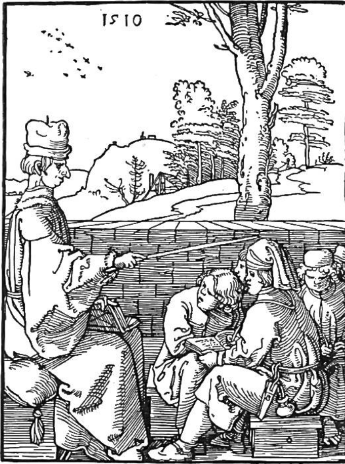
Der Schulmeister, Holzschnitt von Albrecht Dürer (1471–1528).