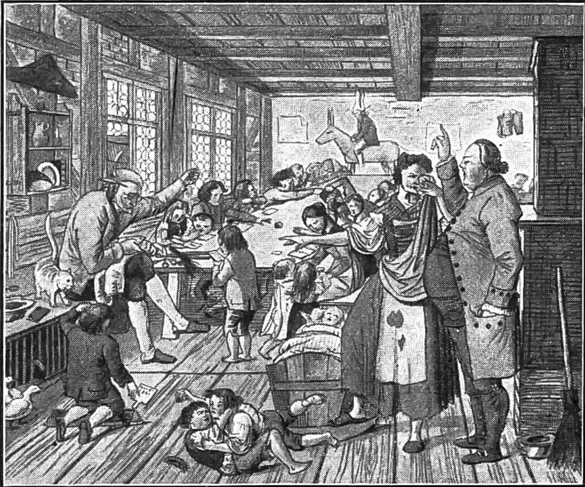
Landschule vor 120 Jahren. Der Dorfschneider ist zugleich Schulmeister. — Ein Schüler sitzt zur Strafe auf dem „Schulesel“, ein anderer muss auf einem kantigen Scheit knien.

notwendig, dass sie noch ein Handwerk ausübten. In einem Dörfchen des Berner Oberlandes verdiente noch ums Jahr 1800 der Ziegenhirt mehr als der Lehrer. Wenn man davon liest, dass die Lehrer „der guten alten Zeit“ wahre Prügelmänner waren, so hat man anderseits auch Beispiele von Lehrern, die tatsächlich aus Liebe zur Jugend ihres Amtes walteten.