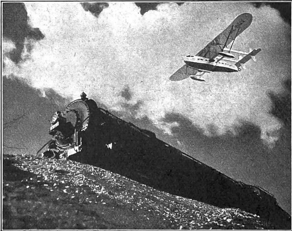
Schnelligkeits-Wettbewerb zwischen Eisenbahn und Flugzeug.