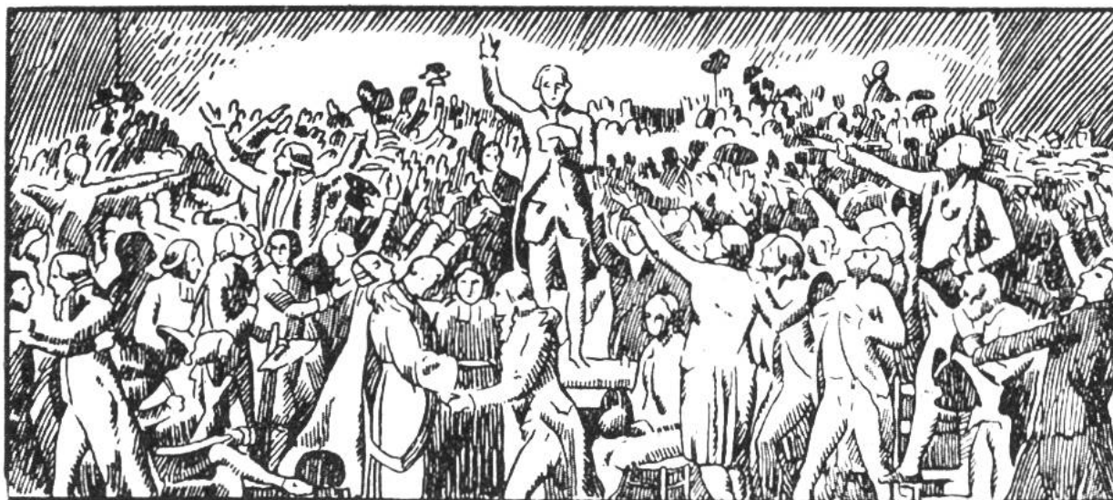
Der Schwur im Ballspielhause zu Versailles am 20. Juni 1789.