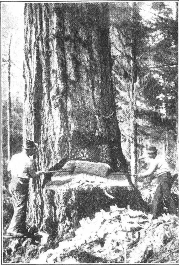
Wälder sterben für die Papierindustrie. Ein uralter Mammutbaum wird in Nordamerika gefällt.

Wir können alle wirksamen Naturschutz treiben, wenn wir Papier sammeln, nicht fortwerfen oder unnötigerweise verbrennen, und es dann den Altwarenhändlern verkaufen. Diese führen die Massen verbrauchten und zerrissenen Papiers wiederum den Papierfabriken zu, welche sie einstampfen und damit entsprechende Holz-mengen sparen können.