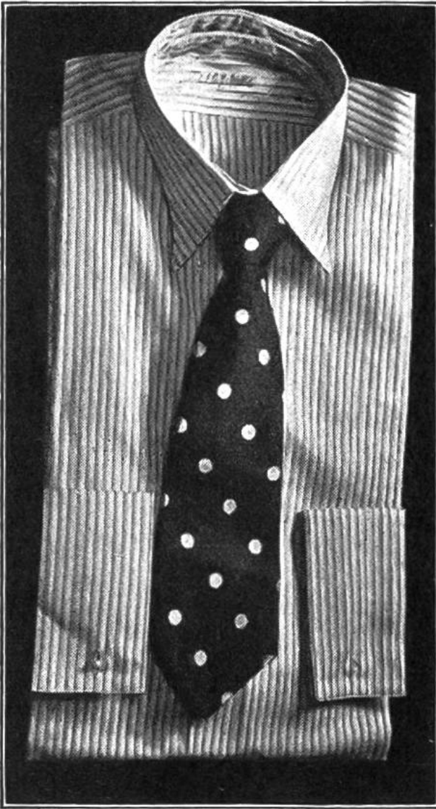
Krawatte mit Flanellette-Streifchen als Einlage.