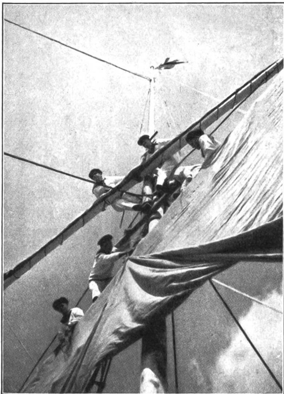
Matrosen bei der Arbeit hoch oben in den Segeln.