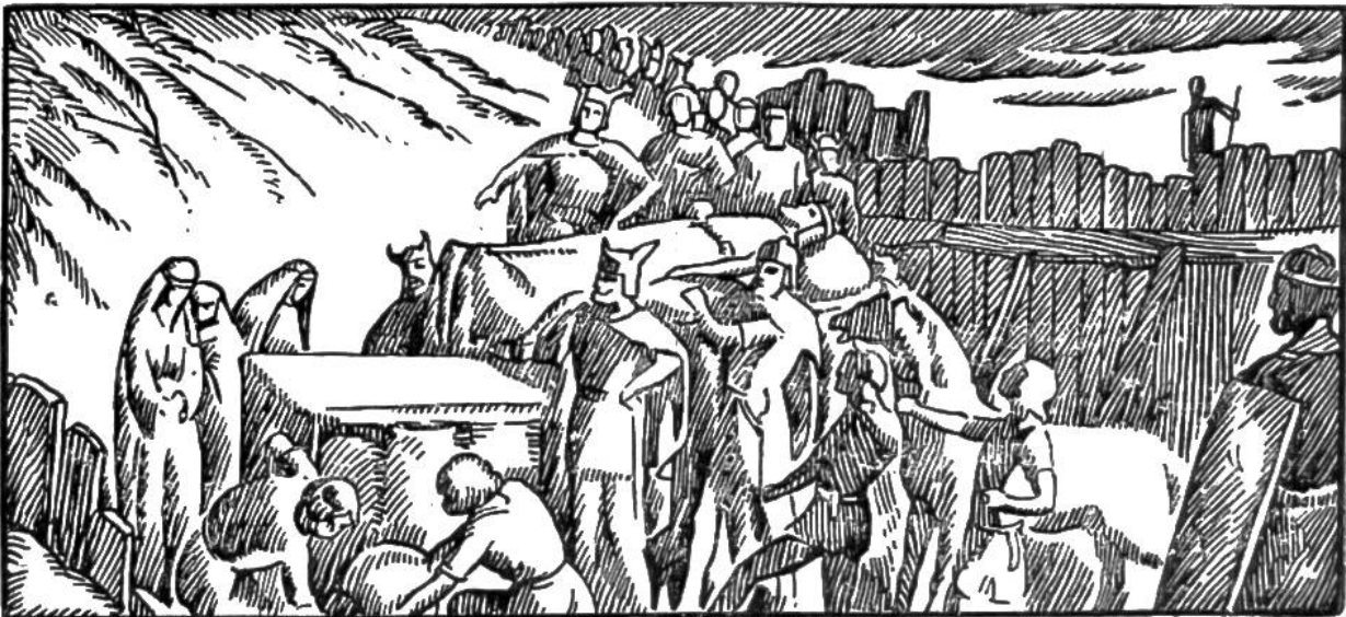
Bestattung Alarichs im Busento.