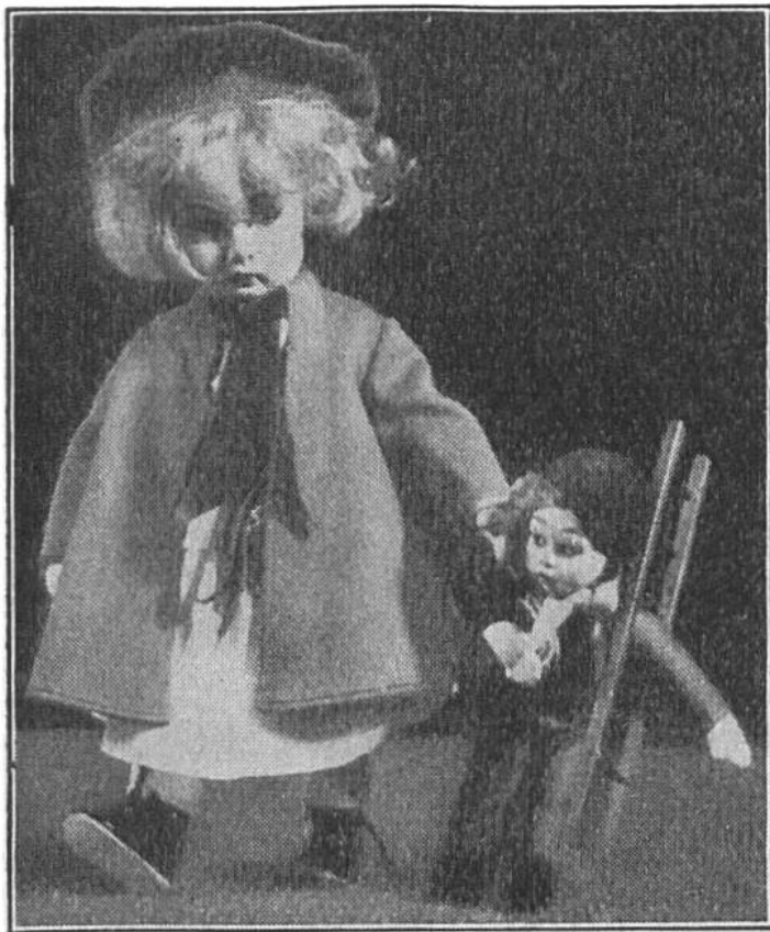
Zum Ausgehen bereit!

Achseln werden mit Grundnähten zusammengefügt, dann gut ausgebügelt, ebenso die Ärmelnaht. Die Kanten rings um den Mantel und der vordere Ärmelrand sind schmal umzubiegen und kantig abzustepfen. Dem geraden Kragen schneidet man eine Echarpe an. Diese wird mit Knopflochseideringsum festoniert. Nicht zu eng stechen! Das mittelste, schmalste