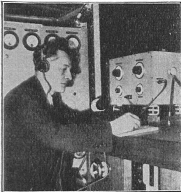
Blick in das Innere der fahrbaren Radiostation. Der Beamte kann mit dem Polizei-Hauptquartier und mit Polizeipatrouillen in Verbindung treten.