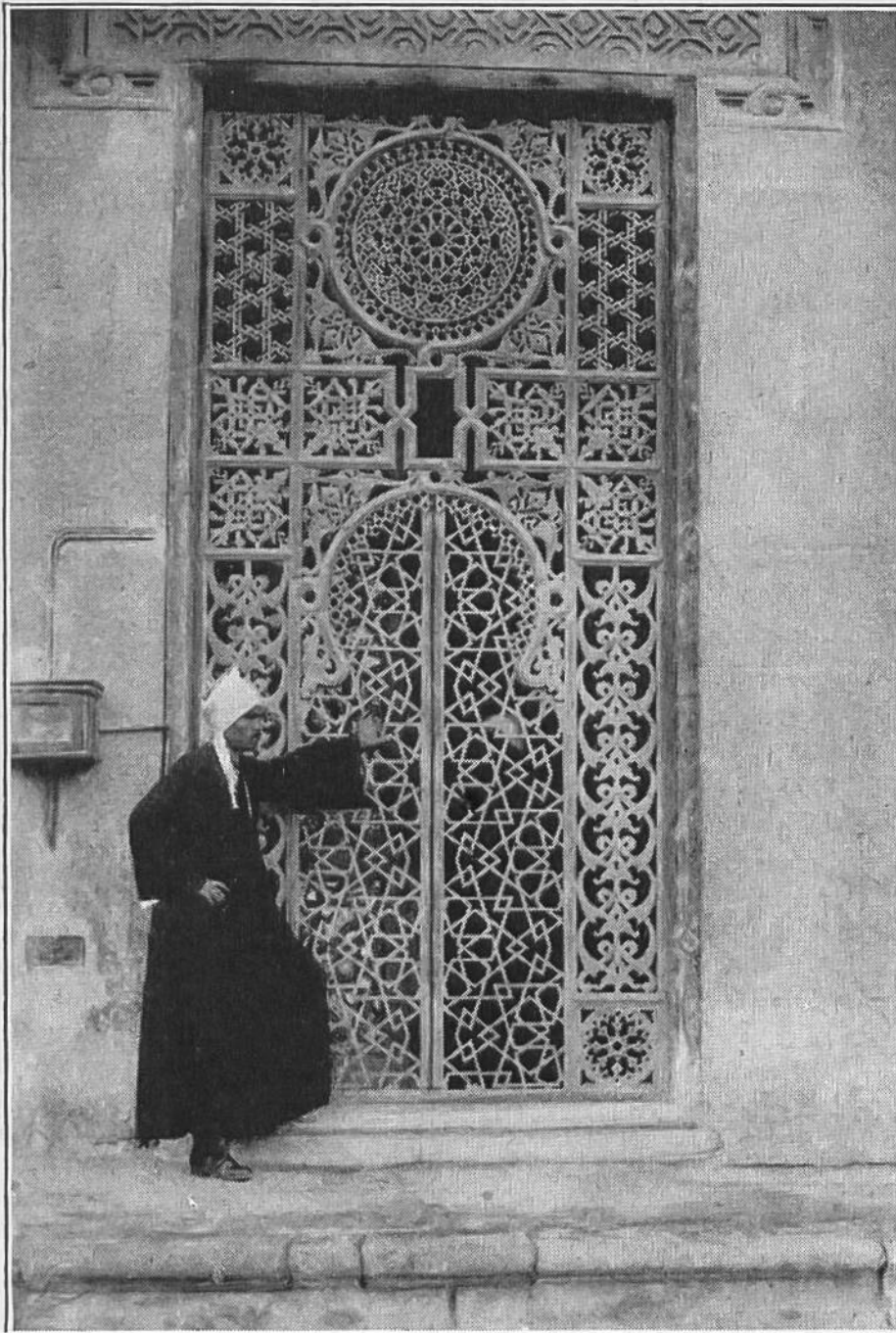
Prächtig gearbeitetes Tor an einer Moschee in Kairo.

sie beeinträchtigt nie die Form und den Zweck des bearbeiteten Gegenstandes.