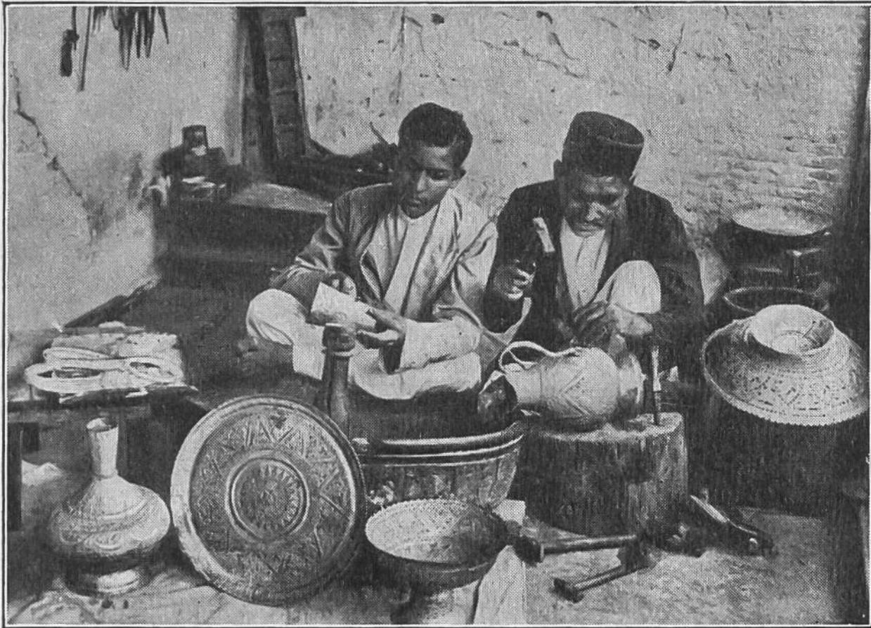
Der alte und der junge Kunstschmied. Auf diese Weise überträgt sich das Können von Generation zu Generation.

lebt noch heute in der gleichen einfachen und anspruchslosen Weise wie schon ihre Väter und Vorväter. Sie braucht, um glücklich zu sein, kein elektrisches Licht, keine Automobile, Radioapparate und wie diese technischen Errungenschaften alle heissen. Die Orientalen werden deshalb von vielen Europäern als ein rückständiges Volk bezeichnet, und tatsächlich sind sie in den Wissenschaften, besonders in der Chemie, der Physik und der Mathematik von den Europäern weit überflügelt worden. Unsere Reise in den Orient enthüllt uns aber nicht nur das; sie zeigt uns auch, dass die Orientalen in anderen Dingen viel begabter sind als wir. Beim Schlendern durch die engen Gassen morgenländischer Städte bleiben wir immer und immer wieder vor den Werkstätten der orientalischen Handwerker stehen und bewundern ihre mit so grossem Geschmack ausgeführten Arbeiten. Sehen wir doch ein wenig jenem Kunstweber zu! Ohne Vorlage, sich ganz auf sein Gefühl verlassend, webt