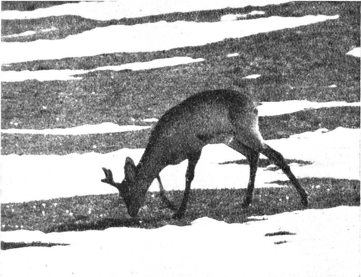
Zweijähriger Rehbock äst die ersten Krokusse, die auf der Waldwiese blühen.

Ausgang aus seiner Winterwohnung noch dick mit Schnee zugedeckt ist.