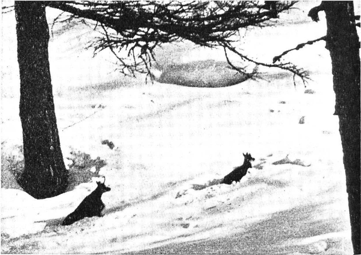
Gemse mit Kitz im tiefen Schnee watend auf der Suche nach Futter.

manches Tier dem Hungertod entrissen worden. Diese Notfütterung durch hilfsbereite Wildfreunde setzt aber eine gewisse Erfahrung voraus, damit nicht mehr geschadet als genützt wird.