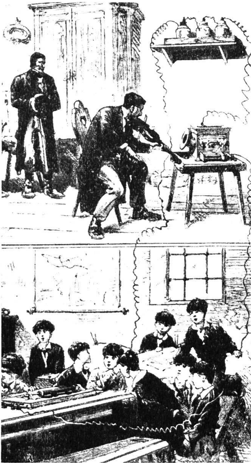
Schüler im Garnier'schen Institut in Friedrichsdorf können das Wunderbare kaum fassen, sie vernehmen aus dem kleinen Apparat auf dem Tisch Geigenspiel. Oben: Sendeapparat. (Nach einer alten Darstellung.)