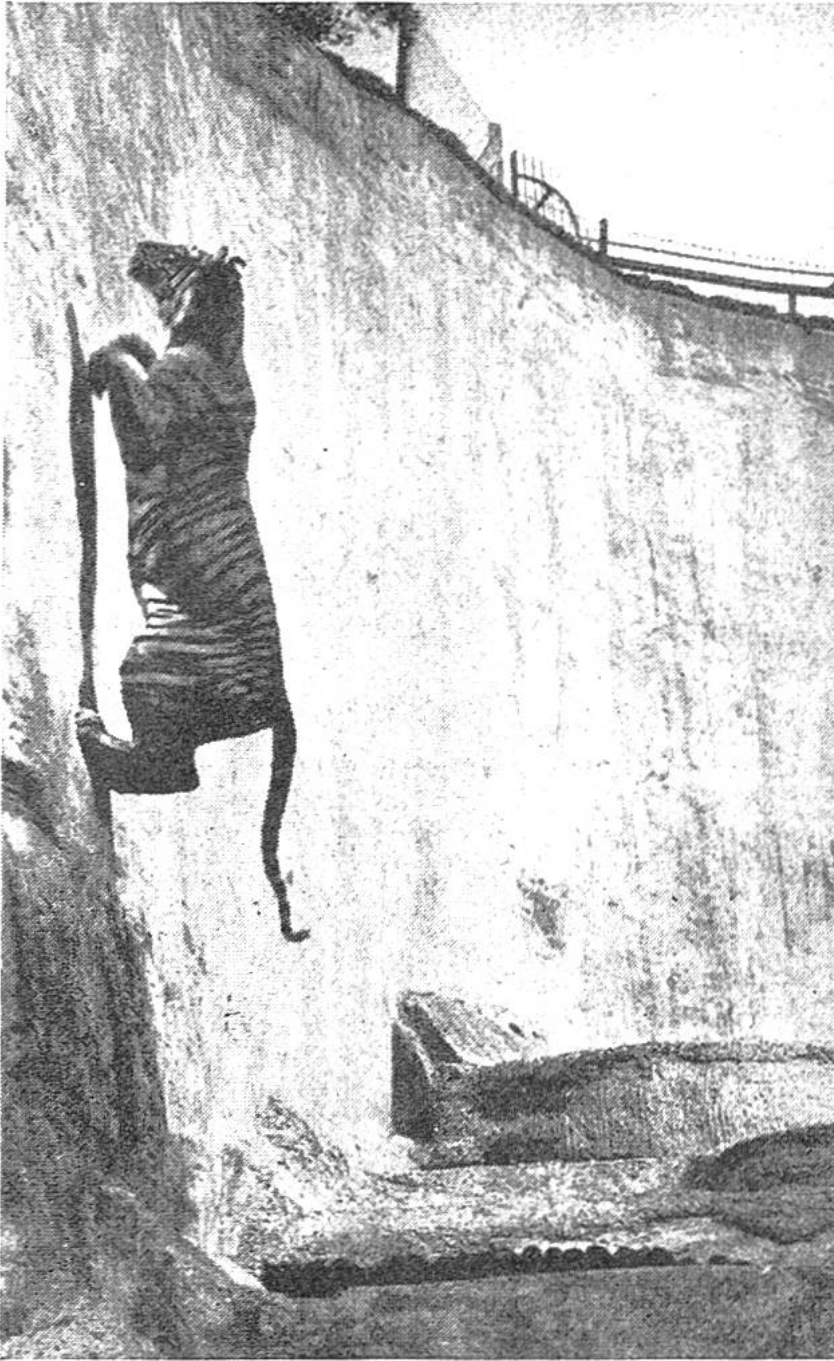
Der gefangene Tiger übt sich an den hohen Mauern seines weiten Zwingers im Hochsprung.