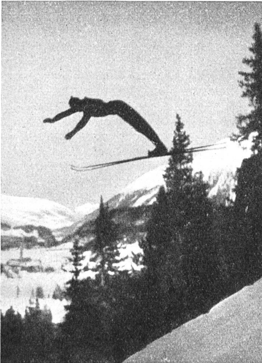
Ein kühner Ski sprung.