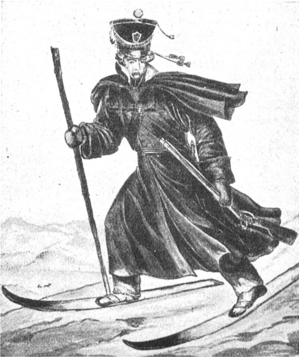
Soldat der alten norwegischen Armee auf Ski.