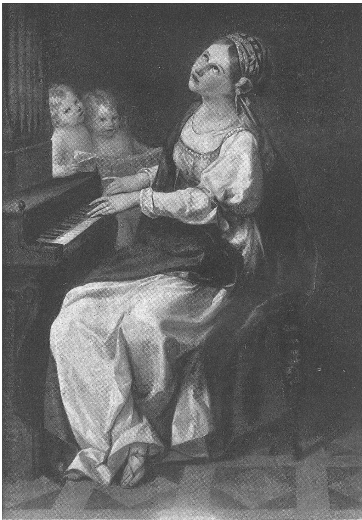
HEILIGE CÄCILIA AN DER ORGEL, von Angelika Kauffmann.

Eigentum der Gottfried-Keller-Stiftung, deponiert im Kunstmuseum in Bern.