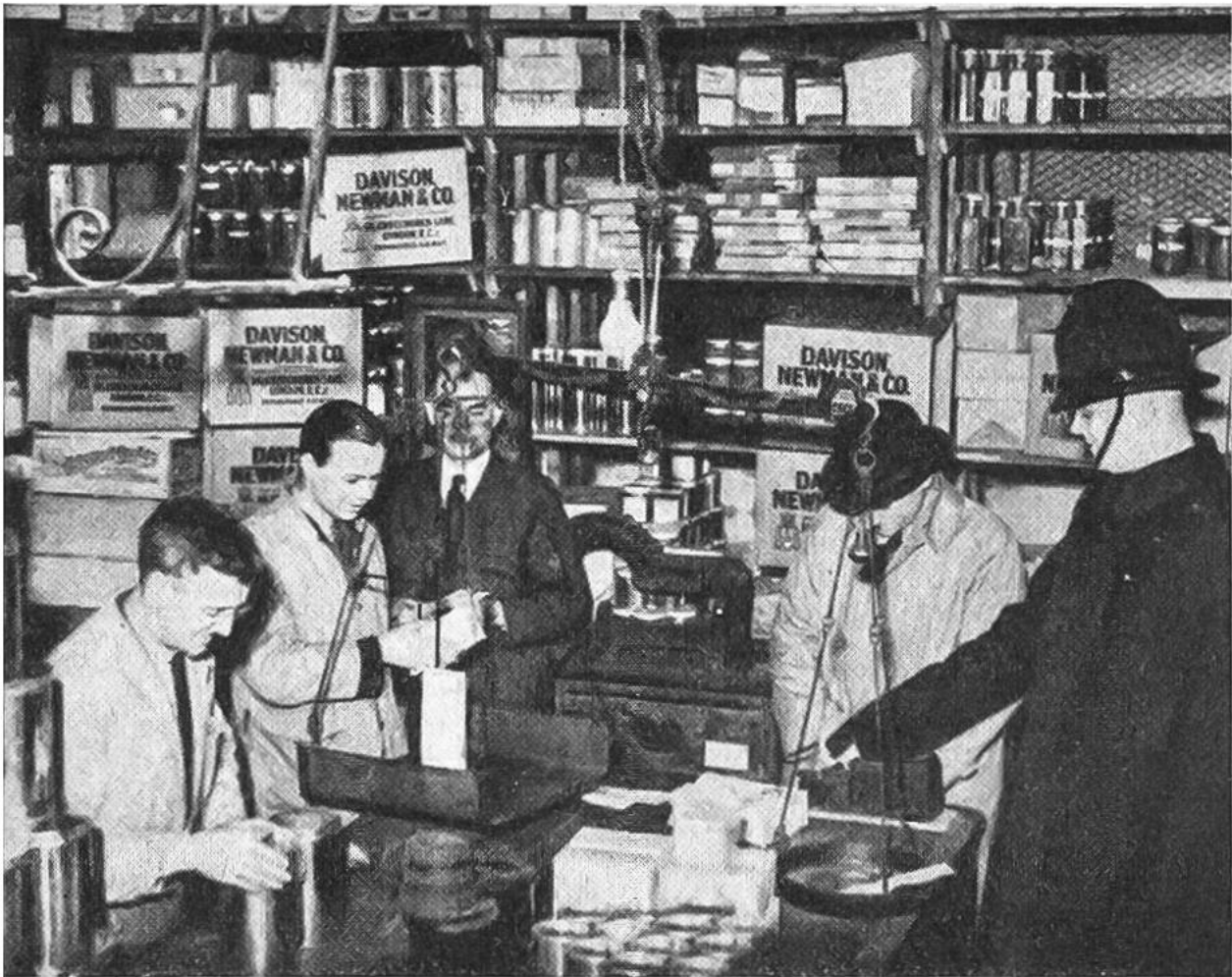
Die Firma Davison, Newman & Co. ist eine der ältesten Teehandelsfirmen Londons. Das Bild zeigt einen der zahlreichen Verkaufsräume des Hauses.

Hudsonflusses. Alle standen unter englischer Oberhoheit. Handel und Industrie jedoch durften sie nicht treiben, alles musste aus England bezogen werden. Die Kolonien wurden auch gezwungen, fremde Waren in England teurer zu kaufen, als sie dieselben anderswo hätten haben können. Ihre Exportprodukte durften sie nur an England verkaufen und zwar billiger als sie diese bei freiem Handelsverkehr sonst hätten absetzen können.