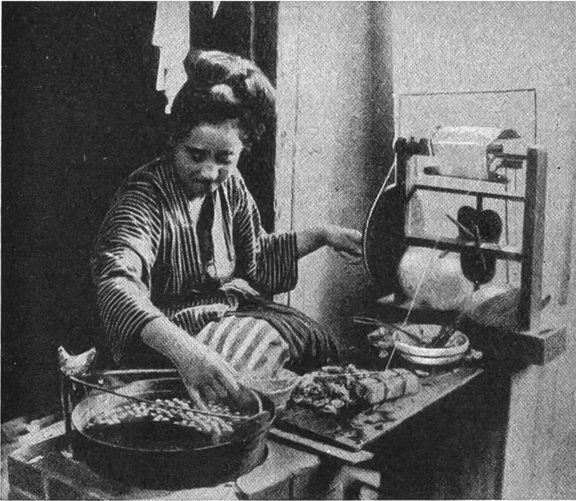
Japanerin beim Seidenspinnen. Nach dem Aufweichen und Bürsten der Kokons in heissem Wasser werden die Fäden mehrerer Kokons zusammengefasst und auf einen hölzernen Haspel aufgewunden.

Feinde der Seidenraupen sind vor allem ansteckende Krankheiten, die oft ganze Raupenkolonien in kurzer Zeit dahinflaffen und dem Züchter schweren Schaden verursachen. Schon der grosse Gelehrte Pasteur hat diese Krankheiten erforscht und mit Erfolg bekämpft. Die moderne Wissenschaft bedient sich neuestens eines merkwürdigen Mittels, um gesunde Raupen von kranken zu unterscheiden. Die Brut wird mit einer Speziallampe angestrahlt, die für das menschliche Auge unsichtbare Strahlen aussendet. Die gesunden Raupen leuchten unter dieser Lampe grau-violett, die kranken aber in grellem Gelb; die Angesteckten weisen gelb-graue Flecken auf. Nun können die gesunden Raupen leicht von den andern getrennt und vor Ansteckung bewahrt werden.