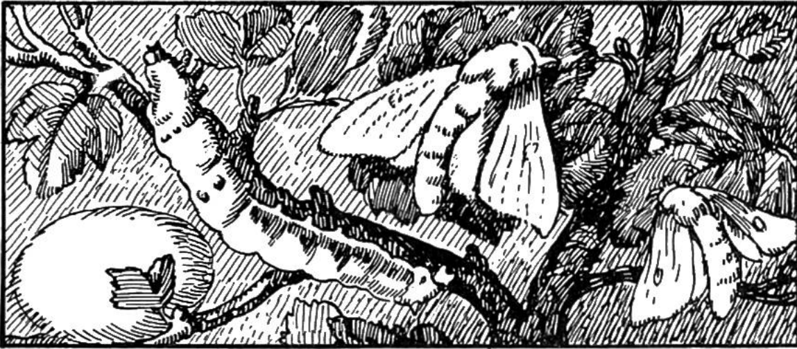
Seidenspinner und -Raupe am Maulbeerbaum. Links die verpuppte Raupe in der Gespinsthülle, „Kokon“ genannt, aus der die Rohseide gewonnen wird.