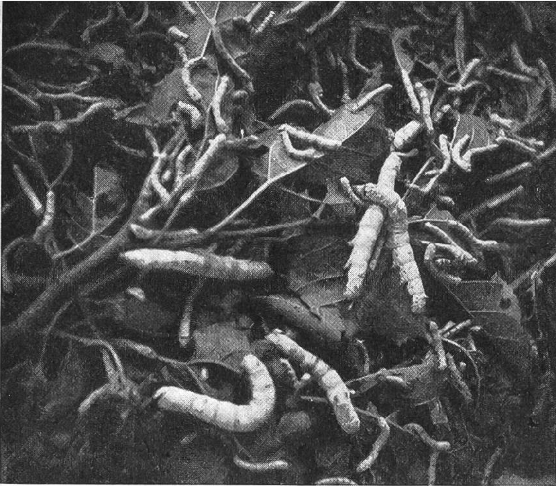
Seidenraupen kurz vor der letzten Häutung. Bald werden sie sich einspinnen.

Seidenspinnen, verzichten. Sie wagte ihr Leben, um einige Eier des Seidenspinners über die chinesische Grenze zu schmuggeln und verbarg das kostbare Gut in den Blumen ihres Kopfputzes. Der kühne Versuch gelang, bald verbreitete sich die Seidenraupenzucht über Zentralasien und Indien. — Von Ceylon kehrten ums Jahr 550 zwei Mönche nach Byzanz (Istanbul) zurück, die in ihren hohlen Bambusstöcken Eier der Seidenraupe verborgen hatten. Der christliche Kaiser Justinian vermochte die Bedeutung dieses seltsamen Geschenkes wohl zu schätzen. Bald entwickelte sich die Seidenindustrie im nahen Orient. Von dort gelangte sie über Griechenland nach Italien und durch die Araber nach Spanien. Noch heute wird die Seidenraupe wegen ihres vielbegehrten Gespinnstes in Italien und Griechenland gezüchtet. Im milden Klima dieser Länder gedeiht der Maulbeerbaum, von dessen Blättern sich die Seidenraupe ernährt.