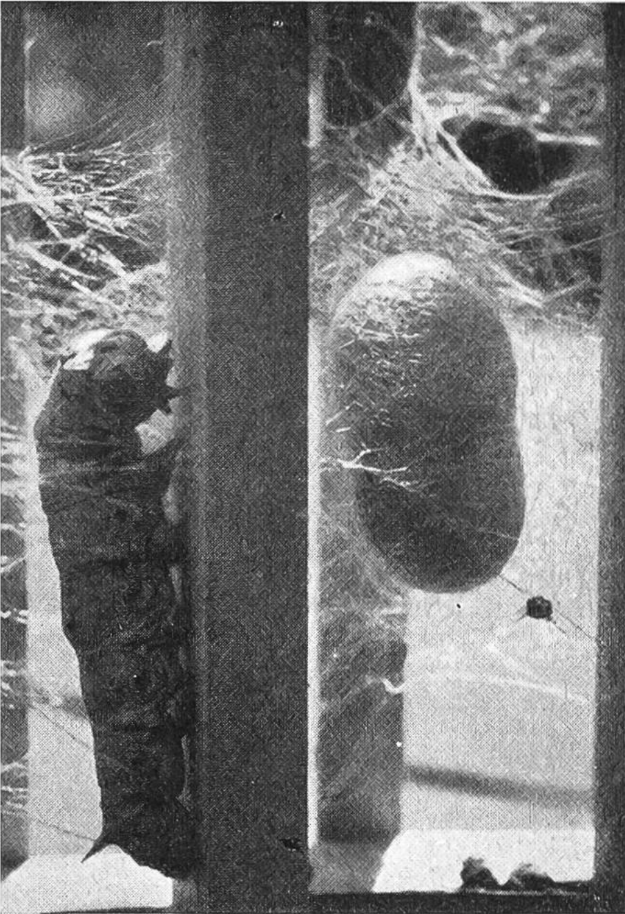
Ausgewachsene Seidenraupe beim Spinnen. Unablässig bewegt sie den Kopf (in Form einer 8) und

umwickelt sich mit dem hauchdünnen, kilometerlangen Seidenfäden, den ihre Spinndrüse absondert. — Rechts ein fertiger Kokon.