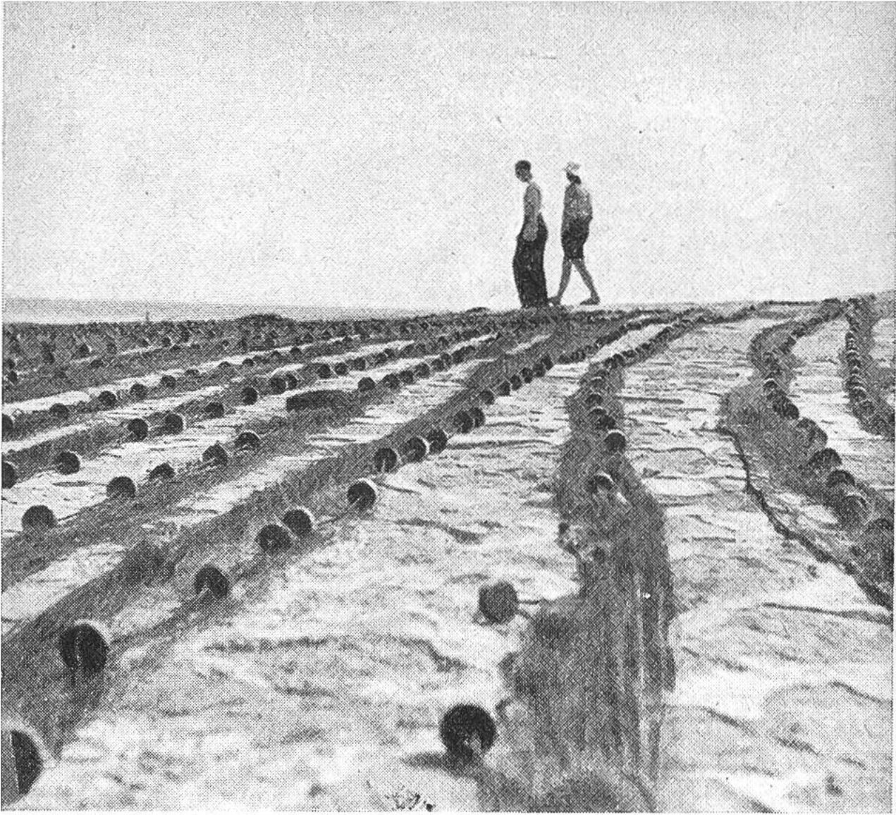
Zum Flicken und Trocknen ausgelegte Netze.

zügen melden, so fahren viele tausend Seeleute zum Fange aus. 20—60 km von der Küste entfernt, werden Netze in einer Gesamtlänge von über 3000 km gespannt. Ein guter Fang bringt etwa 1000 Tonnen Heringe ein; aber bei Riesenschwärmen sind schon 60 000—100 000 Tonnen Heringe gefangen worden. Das Herannahen der Heringsschwärme erkennt der Fischer an den sogenannten „Heringszeichen“. Es sind dies hungrige Vogelscharen und verschiedene Raubfische, denen die wandernden Heringe eine willkommene Beute sind. Bei dem Versuche, ihren Feinden zu entrinnen, drängen sich die verfolgten Heringe oft nahe der Oberfläche so dicht zusammen, dass ihre silbern blinkenden Leiber sich im Wasser zu sogenannten Heringsbergen übereinander-