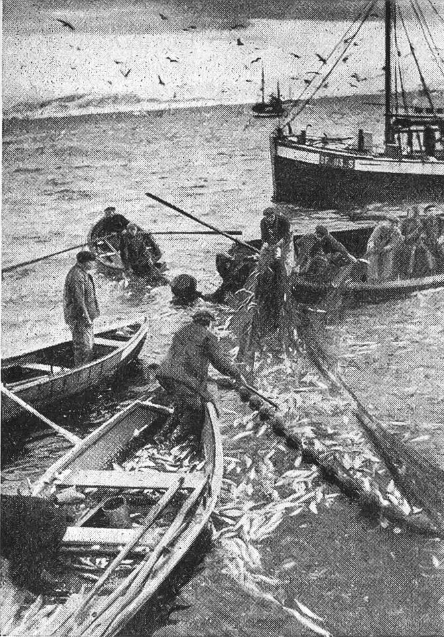
Silbern glitzert es in den Netzen; ein reicher Fang Heringe wird in die Boote gehoben.

türmen, wobei zwischen den Fischen aufsteigende Luftblasen den Eindruck erwecken, als ob das Wasser koche.