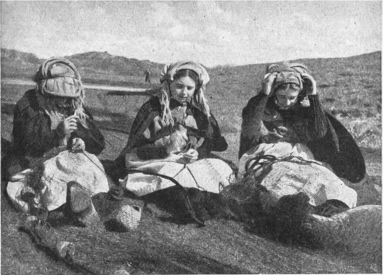
Sorgfältig werden die Netze ausgebessert.

Das Ausbleiben der Schwärme jedoch bedeutet ein mageres Jahr. Der Hering lebt fast in allen Meeren. In der Laichzeit wandert er in unermesslichen Scharen zu den Laichplätzen. Grosse Heringsschwärme treten meist sehr unregelmässig, manchmal jahrzehntelang hintereinander, dann wieder lange Zeit gar nicht in einer Gegend auf. Die Heringe sind sehr empfindlich für die Temperatur des Wassers; sie folgen den Meeresströmungen, die ihnen am besten behagen. Die Meeresströmungen aber werden beeinflusst von der Schneeschmelze in den Polargegenden, die ihrerseits wieder durch die regelmässigen Schwankungen der Einflüsse durch die Gestirne bedingt ist. So erklärt es sich, dass die Fischperioden mit den sogenannten Sonnenfleckenperioden übereinstimmen.