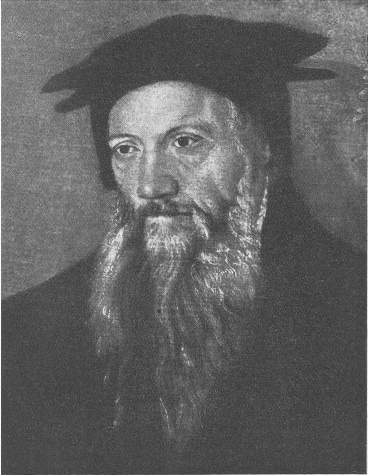
Konrad Gessner, Zürcher Arzt und Naturforscher, in seinem 48. Altersjahr gemalt von Tobias Stimmer.