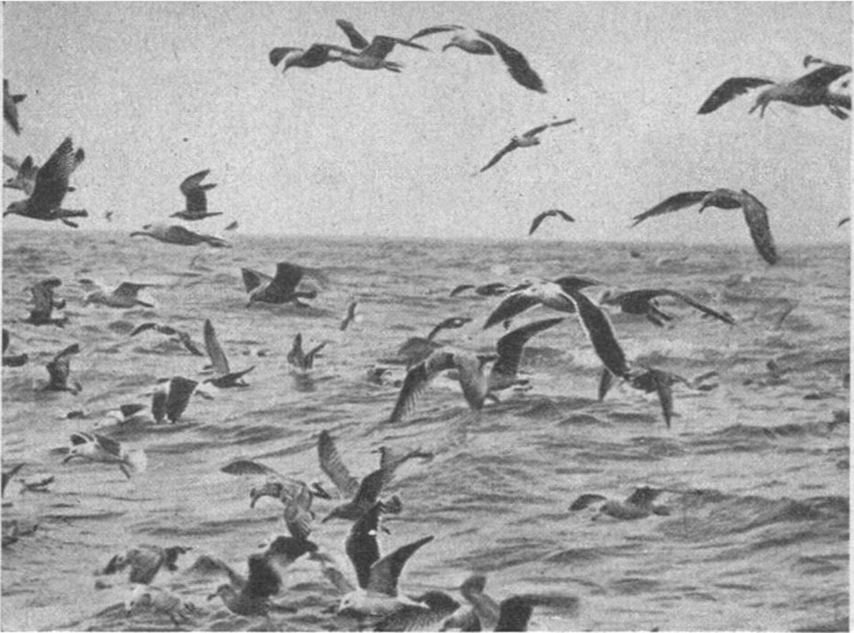
Ein Schwarm Möwen über dem Meer.

und Fülle zur Verfügung stehen, wird zu gleicher Zeit wie der freilebende von der Zugunruhe überfallen. Wie besessen flattert er umher, als ob der Fahrplan seiner Artgenossen im Freileben auch für ihn verbindlich wäre. Manchmal trifft es sich mit dem Abreisedatum recht ungeschickt, so dass riesige Vogelgesellschaften von Schnee und Eis überrascht werden oder unterwegs in ein schweres Unwetter geraten. In den letzten Jahren ist es wiederholt vorgekommen, dass grosse Schwärme von Schwalben und anderen Zugvögeln in Schneestürme geraten sind, völlig erschöpft von tierfreundlichen Menschen gesammelt und mit dem Flugzeug in günstigere Gebiete verschickt wurden. Beim Mauersegler, der gewöhnlich in den ersten Maitagen bei uns eintrifft, kann es z. B. vorkommen, dass die Eltern unter dem Zwang des Zuges, der sie schon in den letzten Juli- oder ersten Augusttagen überfällt, ihre noch nicht flugfähigen Jungen im Nest einfach ihrem Schicksal überlassen müssen.