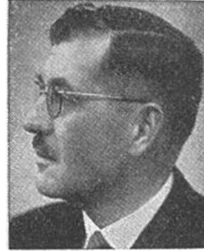
Dr. Karl Kobelt von Marbach (St. G.) * 1891, seit 1941 i. Amte Militärdepartem.