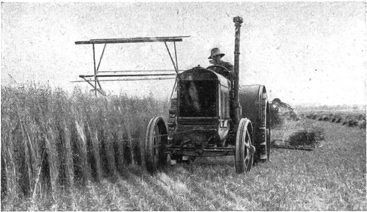
Schneiden des Hafers mit Bindemäher und Traktor in einem französischen Grossbetrieb.