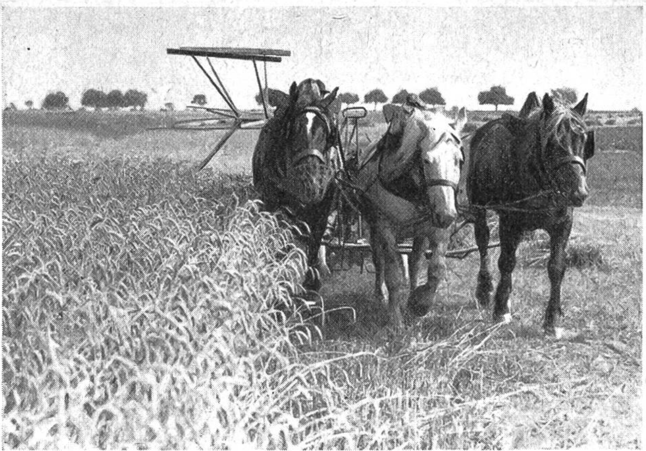
Erntezeit! — Der von drei kräftigen Pferden gezogene Getreidebindemäher bei der Winterweizenernte.

mechanischen Einrichtungen in Gewerbe und Industrie. Viele an sich kostspielige Geräte werden oft nur während weniger Tage im Jahreslaufe gebraucht. Aus diesem Grunde gewinnt in der kleinbäuerlichen Landwirtschaft die gemeinschaftliche Maschinenhaltung zur Erzielung eines besseren Nutzergebnisses der Arbeit und einer tragbareren Kostenverteilung erhöhte Bedeutung. Die ersten Versuche zur Technisierung der einst mühseligen und wenig ergiebigen Landarbeit sind nicht viel mehr als 100 Jahre alt. Im Sommer 1831 erstellte im nordamerikanischen Staate Virginia ein einfacher Farmerssohn, namens Cyrus Hall McCormick, in der zum väterlichen Gute gehörenden Schmiede nach vielen erfolglosen Versuchen die erste brauchbare Getreidemähmaschine. Der erst 22jährige Erfinder ahnte wohl kaum, welche umwälzenden Folgen seine wohldurchdachte Konstruktion auf die Gestaltung der neuzeitlichen Landwirtschaftstechnik haben werde. Die Nachfrage nach der zeit-